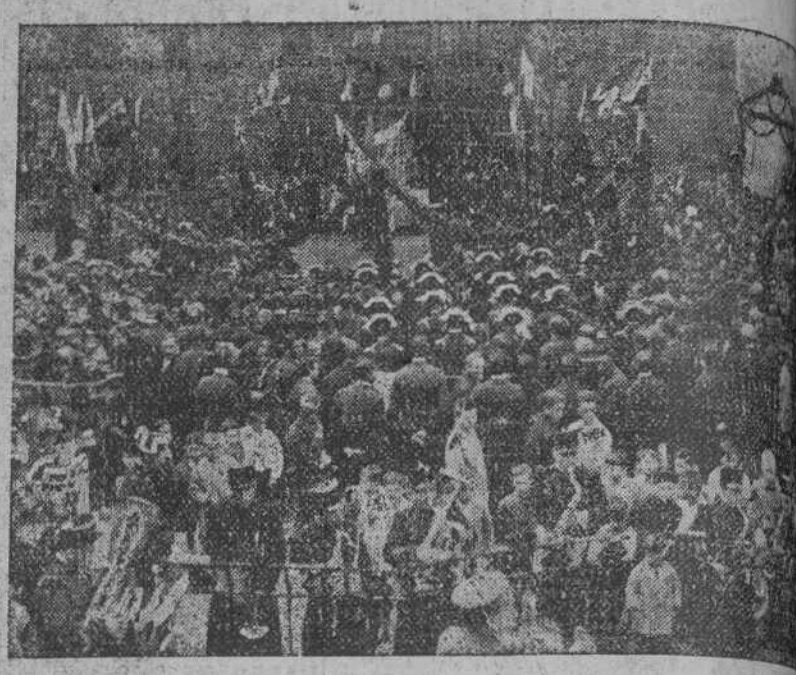
EL DOMINGO EN LIÉRGANES.—Aspecto de la plaza durante la misa.

El señor obispo regresó a Santander antes del banquete por tener precisión de presidir la procesión del Año jubilar, que tuvo lugar por la