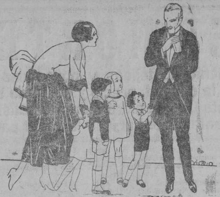
Le gustaron tanto cuando les purgaron con ellos, que cada vez que su papá entra en casa piensan que les trae

ROMBOS LAXANTES Caja, 2 pesetas. Cajita de ensayo, 30 céntimos. En farmacias y droguerías.