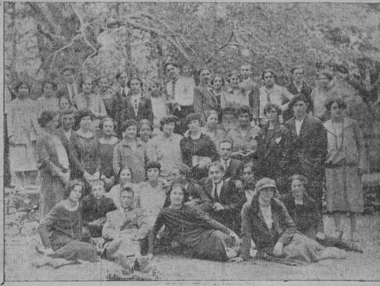
Los excursionistas de «La Armenia Turista», de Barrada, reunidos en un bello rincón de Santillana.