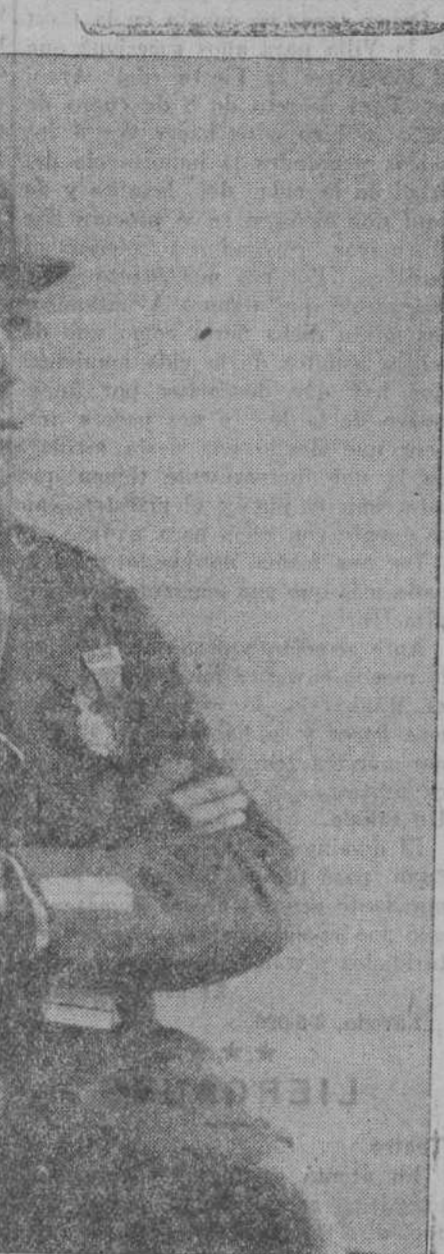
El notable aviador montañés Eloy Formánz Navamuel, que se propone realizar la brava empresa de ir en hidroavión desde Vigo a la Habana.

En un hidroavión no había el mismo peligro que en un aeroplano, pero no hay que perder las esperanzas.