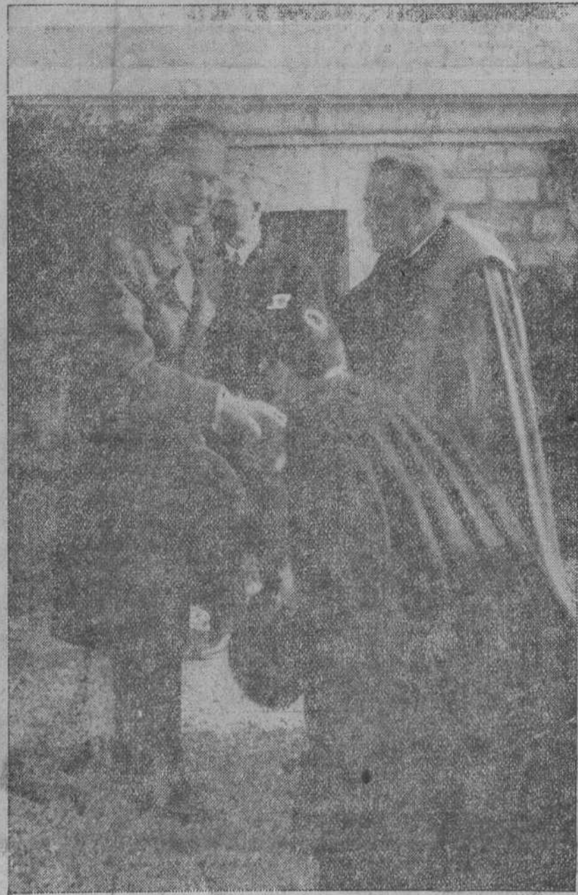
EL PRINCIPE DE ASTURIAS EN LA MAGDALENA.—Su Alteza saludando a las autoridades eclesiásticas en los jardines de la Real posesión.