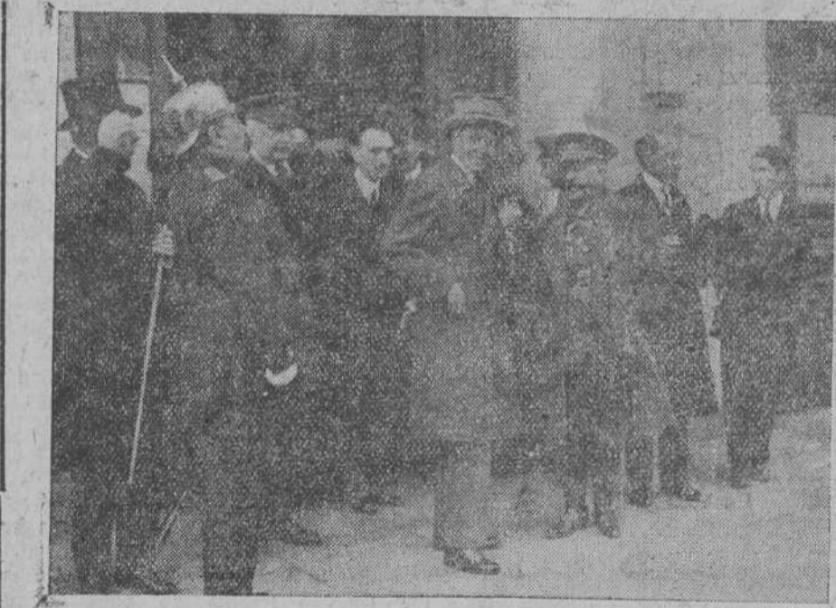
EL PRINCIPE DE ASTURIAS EN SANTANDER.—Don Alfonso con el capitán general de la región, marqués de Cavalcanti, y las autoridades locales, momentos después de descender del tren.

coespañoles, para cambiar impresiones antes de la llegada de los rifeños.