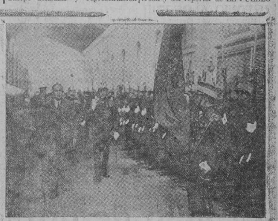
LA LLEGADA DEL PRINCIPE DE ASTURIAS.—El heredero del Trono revistando las fuerzas que le rindieron honores.

Para recibir al príncipe de Asturias bajaron a la estación del Norte todas las autoridades de Santander, el capitán general de la sexta región, señor marqués de Cavalcanti, con sus ayudantes; la Banda municipal; una compañía del regimiento de Valencia, con bandera y música, encargada de rendir honores; Cuerpo Consular y representación