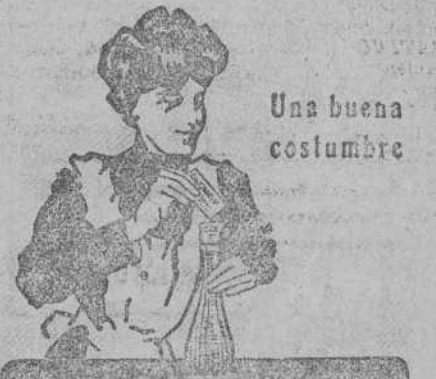
Una buena costumbre

Las mejores MARCAS GARANTI- ZADAS «FAVOR» y «LAPIZE» Accesorios de todas clases.—Articu- los de sport, ingleses.—VERDADERO TALLER DE REPARACIONES. —Precios MAS BARATOS QUE NA- DIE.—No comprar sin consultarnos precios. CASA RUIZ.—Arcos de Dóriga, n.º 5