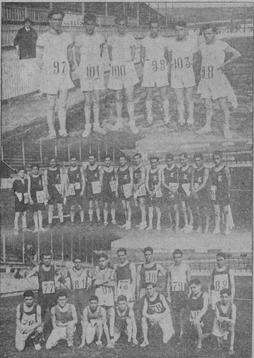
DEL CAMPEONATO DE «CROSS».—Equipos de la Gimnástica, del Racing Club y de la Unión Montañesa, que tomaron parte en la prueba.

diferentes ocasiones de marcar. Así que nos limitaremos a decir escuetamente que Gómez Acebo fué el que dió mayor rendimiento en el ataque y que Torón siguióle en orden de méritos. El delantero centro demostró una vez más lo potentísimo de su chut en los dos tantos que logró, y de manera especial en el último. De los medios, Fidel, y en la zaga Santuiste trabajador, como siempre, y Barbosa muy seguro. Los muriedenses anduvieron desacertados en el primer tiempo, fallando Martínez y Dionisio bastantes pelotas. Después se aseguraron y contribuyeron eficazmente a disminuir la herrota. Los medios actuaron con más igualdad, mereciendo el calificativo de buenos.