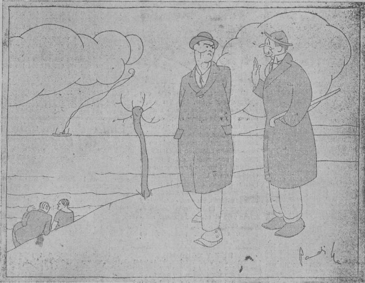
- Pero usted, don Atenedoro, ¿no conoce las Dolores de Campoamor? - No le extraña. Como apenas salgo de casa...