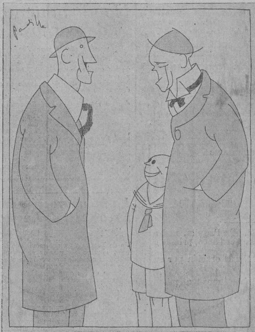
—En Francia no se puede vivir. El Franco está por los suelos. —En cambio el nuestro está por las nubes.