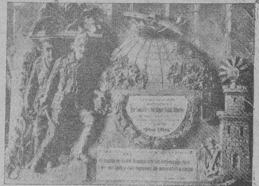
EN EL FERROL.—Preciosa lápida colocada, como recuerdo del «raid», en la casa donde nacieron los hermanos Franco.

que experimentó Colón al oír el cañonazo que disparaban los de la «Pinta» y la voz de ¡tierra! dada por uno de sus marineros.