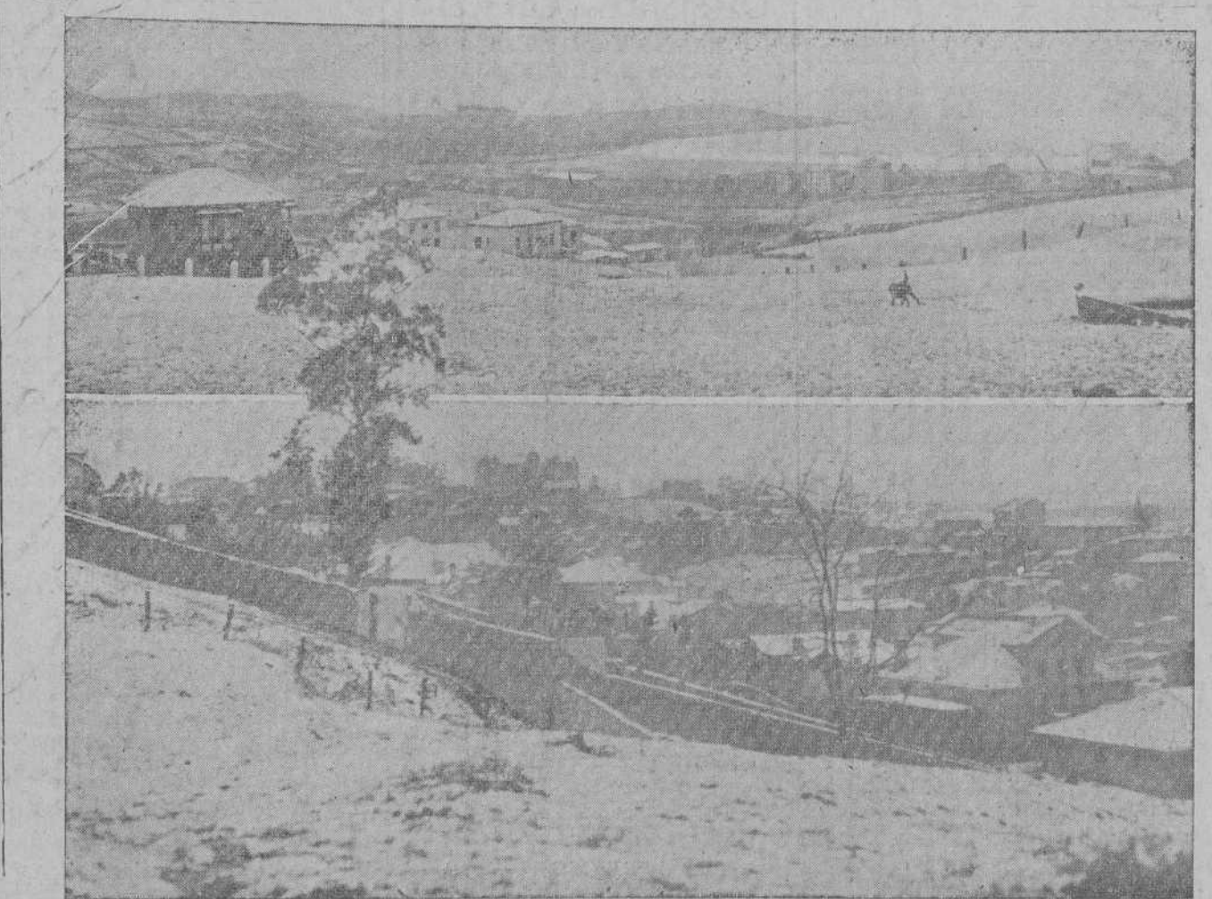
El Sardinero, visto desde el Alta ayer, por la mañana, y la población desde la calleja de Arna, después de la nevada de anteanoche.