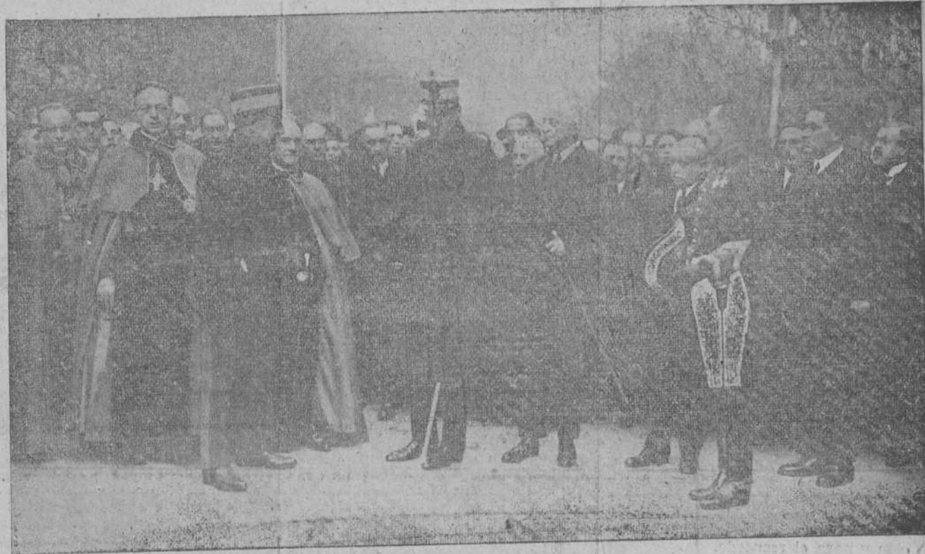
La presidencia del duelo en el entierro de don Antonio Maura.

REBOLLEDO.—Coronas de flores.—Teléfonos números 7-55 y 2-23.