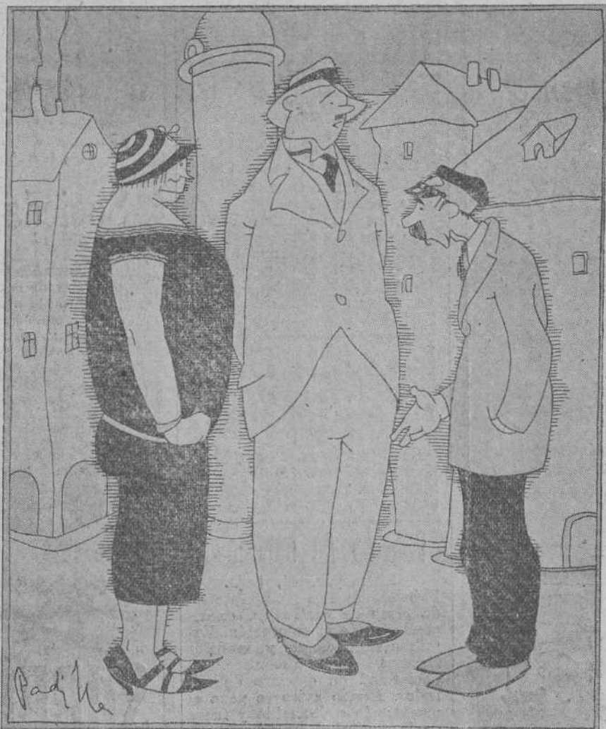
—¿Desean los señores cicerone? Poseo doce idiomas. —Muchas gracias, pero no nos gusta andar entre lenguas.