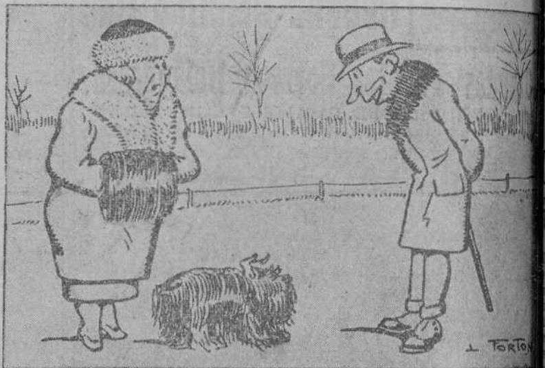
—¿Qué opina usted de mi perrito? —Pues opino, condesa, que si usted le mete una mano por delante y otra por detrás, podría tener un manguito mejor que el que lleva. (De «Le Rire», de Paris)