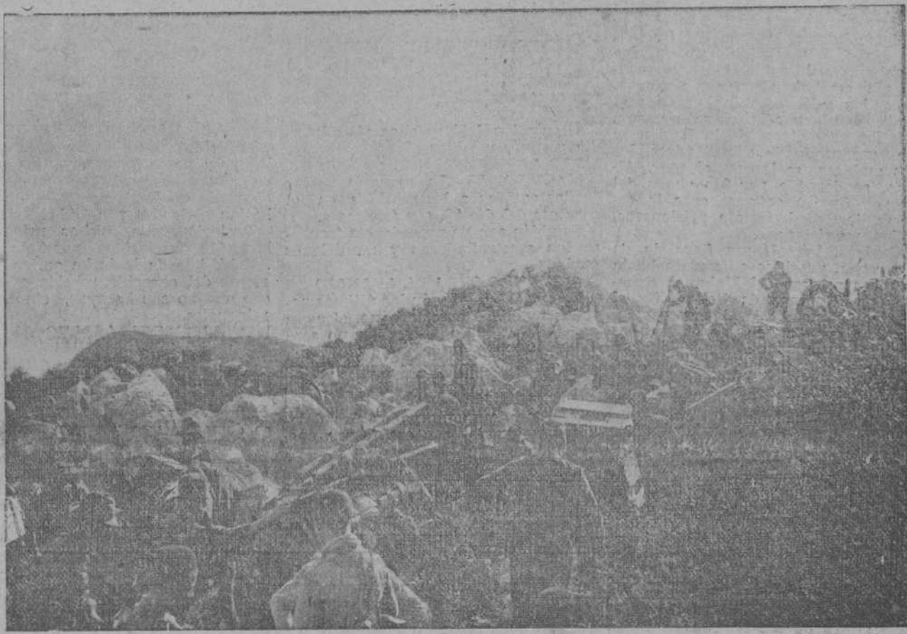
Convey de municiones siguiendo a la columna que ocupó el monte Malmusi. (Foto Agencia Gráfica).

muchas bajas, entre ellas la del capitán Iglesias, que estaba a poquísimos metros de nosotros, afeitándose, y a quien un casco de metralla hiere en la frente. A poco bajan en camillas unos soldados indígenas muertos, destrozados por las bombas. Acompañando a ese terrible cortejo llego a la Loma del Tercio, cansado de tanto trepar por riscos y peñascos, fatigado el cerebro por tanto recuerdo sangriento, encogido el corazón por la tragedia brutal de la guerra.