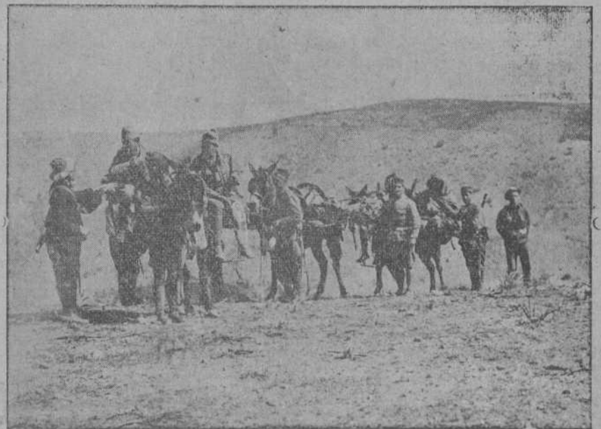
Un detalle de la evacuación de heridos de la línea de Ben Karrich. (Foto Agencia Gráfica).

MELILLA, 23.—A media noche ha fundeado el cañonero «Laya», que conducía a algunos aviadores de los aparatos que sufrieron accidentes en los últimos vuelos.