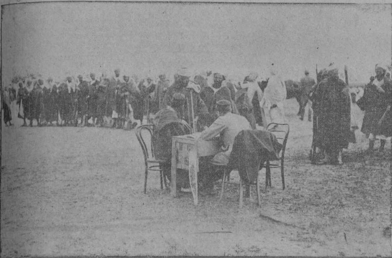
Interesante momento de la reunión de moros en Melilla para la mañana y tropas Regulares.

Intenso bombardeo sobre el monte Malmusin.—Estratagema de los moros que no surte efecto.—El plan del mando francés.—Otras noticias.