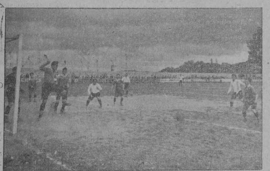
REINOSA.—Un momento del partido Reinosa F. C.—Selección Vasca. (Foto SAMOT).