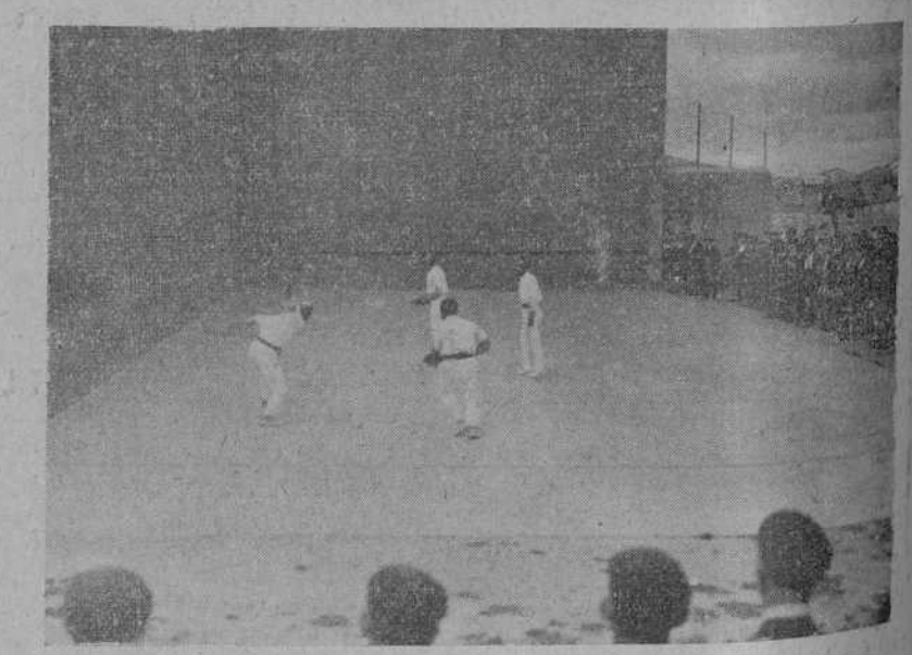
Reinosa.—Aspecto que ofrece el frontón durante los partidos de pelota.

TODA LA CORRESPONDENCIA POLITICA Y LITERARIA DIRIJASE AL DIRECTOR