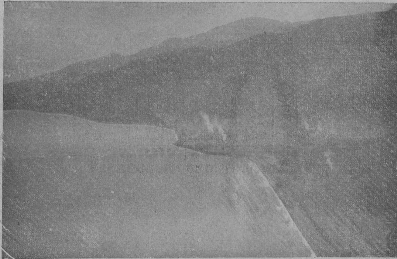
La bahía de Alhucemas, vista desde un avión. En la fotografía pueden apreciarse los efectos de las explosiones de las bombas arrojadas desde los aeroplanos.

MELILLA, 9.—La facilidad con que se efectuó el desembarco en la mañana de ayer sobre el punto elegido por el general en jefe de las fuerzas que operan en Marruecos, ha constituido una gran sorpresa, porque desde el momento que se anunciaron serias