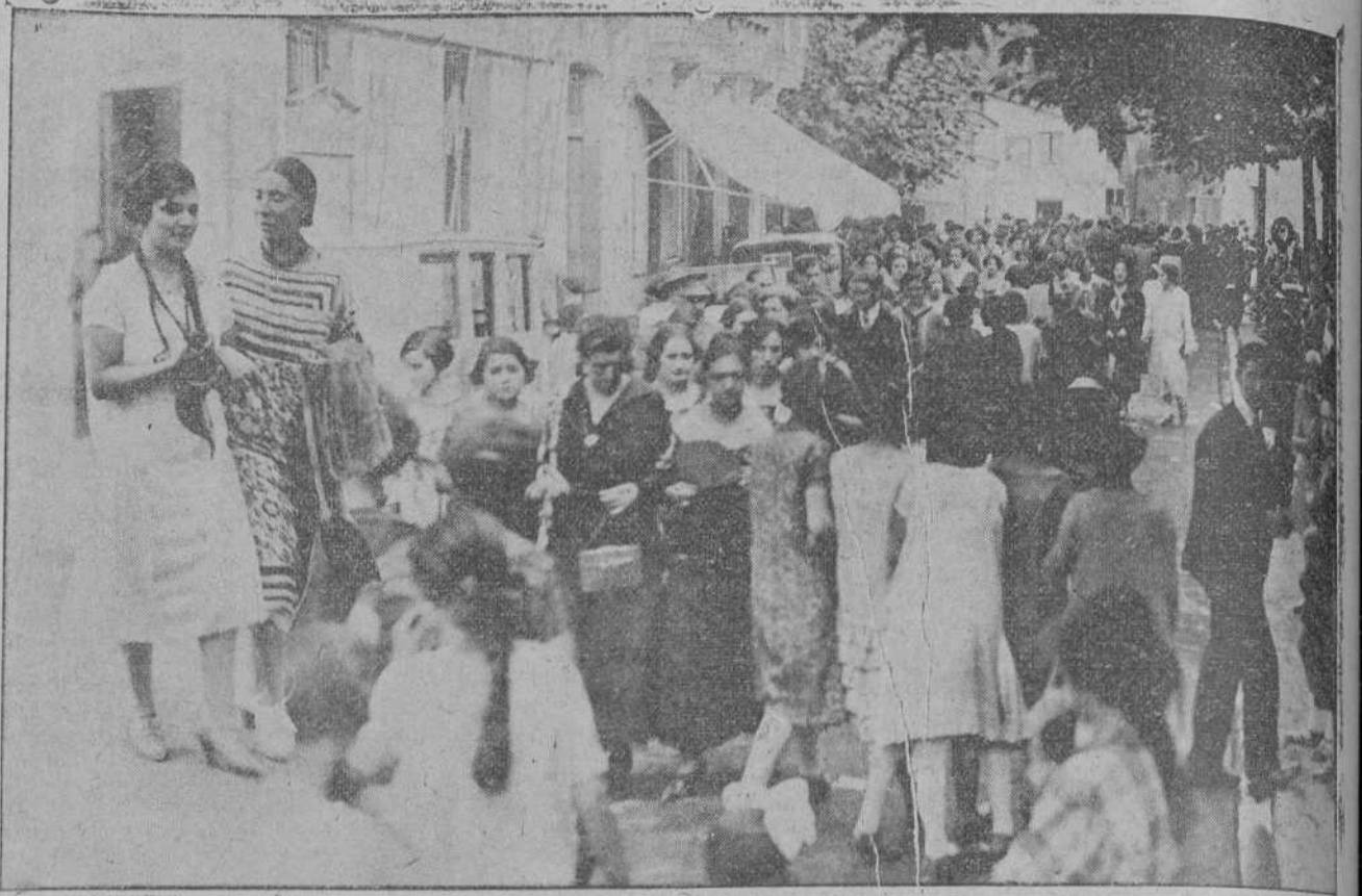
SANTOÑA.—Después de la corrida de toros, la plaza de San Antonio adquiere la animación extraordinaria de los paseos de las grandes ciudades. Ved a las muchachas, con sus vestidos de fiesta y sus bocas sonrientes oyendo a la música y esperando que suene la hora del baile en el Casino-Liteo.

Excusado es decir que estuvo plérido de gente y que se bailó sin cesar, para lo que había dos músicas y el tamboril; en una palabra, baile continuo y en este plan se estuvo hasta la madrugada.