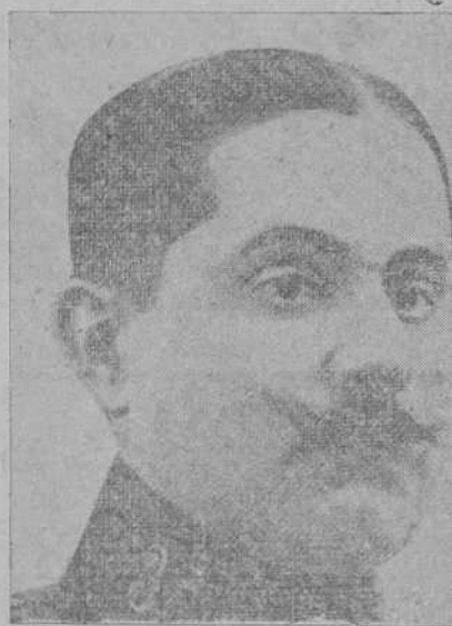
El valiente general Saro, que mandó la columna que ayer desembarcó intrépidamente en Alhucemas.