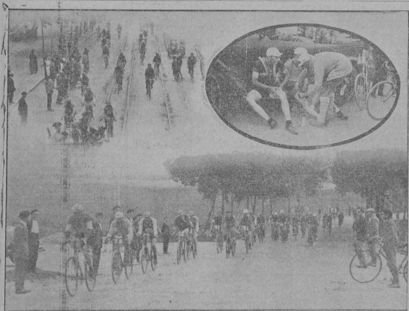
DE LA VUELTA A CANTABRIA.—Los corredores atravesando Santander, presididos del coche piloto.—Algunos de los corredores dándose masaje momentos antes de la salida.—En plena carrera.

«VERKOS» Instituto Biológico Internacional S. A. SAN SEBASTIAN Sección C-1, Apartado núm. 37.