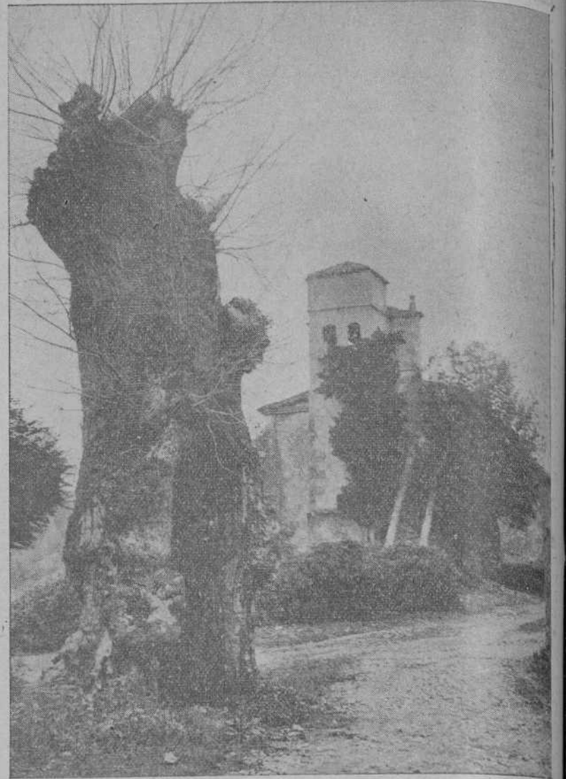
PAISAJES MONTAÑES.—Un bello rincón en Barcenaciones.