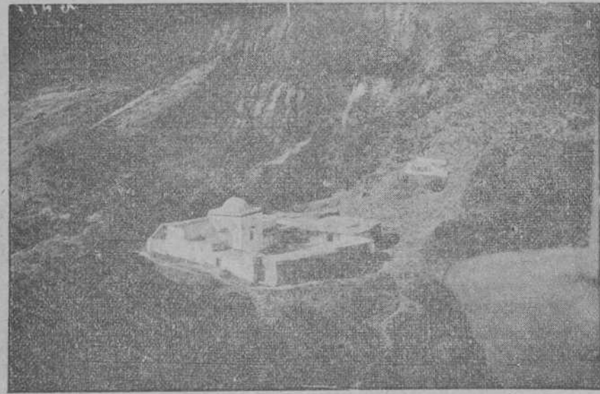
Un morabito enemigo del interior de Benicrriagucl, región bombardeada estos días eficazmente por los aviadores españoles.

Hoy estuvo en Ribadeo, regresando a Luarca al anochece