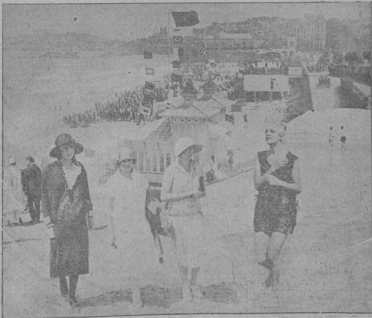
ESCENAS DE LA PLAYA.—En el Sardinero, por la mañana, a la hora del baño.

Descanse en paz el distinguido periodista y reciba su familia nuestro más sincero pésame.