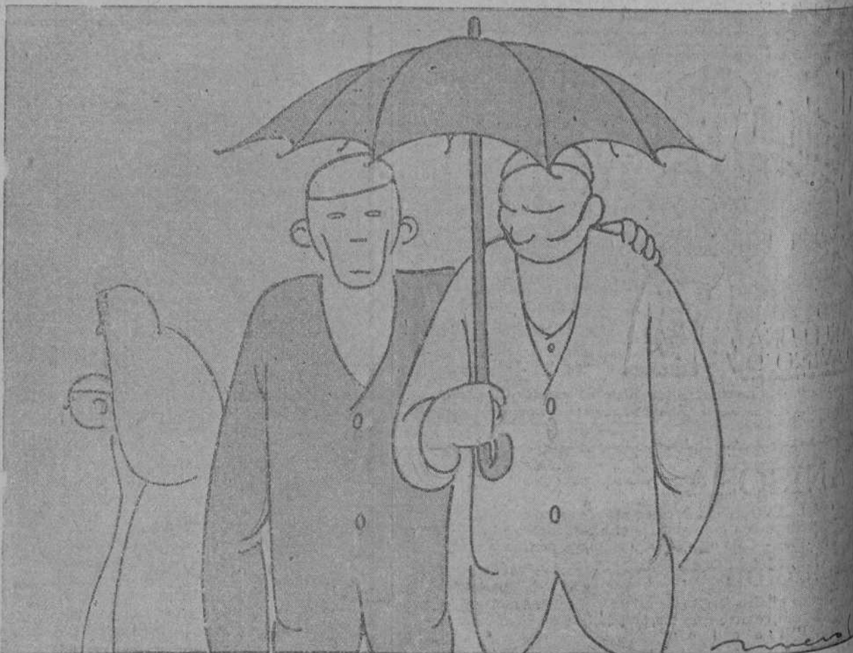
—He leído en el papel que este año hay una buena cosecha de vino. —¿Pues no ha de haberla con esta abundancia de agua?

—La princesa de la Gloria, trasladado de Deauville a Biarritz.