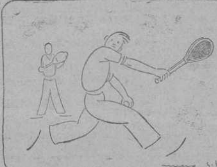
Raquetas y artículos de Sports Armería de ALBERDI San Francisco, 5.—SANTANDER

Interior 4 por 100, a 70,80 por 100 pesetas 5.000. Amortizable 1920, a 95,25 por 100; pesetas 15.000. Tesoros abril, a 101,85 por 100; pesetas 10.000. Ayuntamiento del Astillero, a 75 por 100; pesetas 3.000. Banco Central, a 77 por 100; pesetas 10.000. Almanzas, a 76 por 100; pesetas 35.150. Alicante 1.ª, 50 obligaciones a 303 pesetas una. Valencia-Utiel, a 63 por 100; pesetas 5.000. Viésigo 5 por 100, a 82 por 100; pesetas 8.000. Idem 6 por 100, a 94,25 por 100; pesetas 8.000. Transatlánticas 1922, a 104,60 por 100; pesetas 15.000.