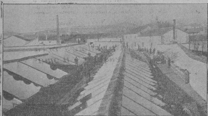
Un detalle de las calles de atrosjes de la magnífica fábrica «Santa Amalia», de Bailén.