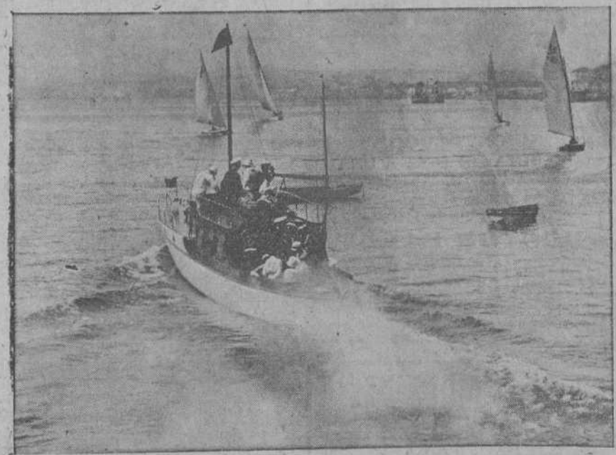
La «Fa-Kun-Tuzim» conduce a la familia real a sus respectivos bañaderos para tomar parte en las regatas.

La Empresa no duda de que por todos será apreciado en lo que vale este sacrificio que realiza gustosa y espontáneamente, en honor de sus abonados, lamentando con ellos el incidente que la obligó a terminar fuertemente la temporada, privándoles de la ópera que mayor interés desper-