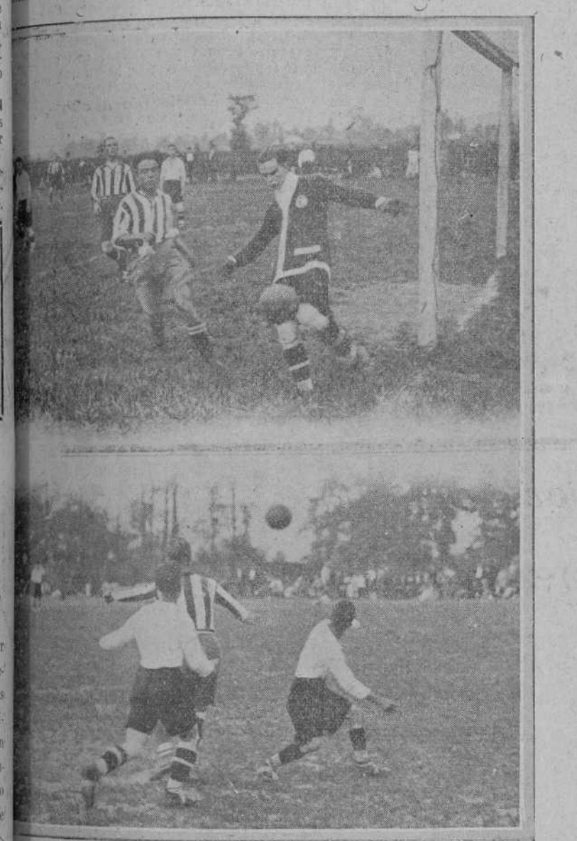
Interesantes detalles del partido entre «Campios F. C.» y el «Español», jugado anteayer en el espléndido campo de Domañanos, de Cabezón de la Sal.