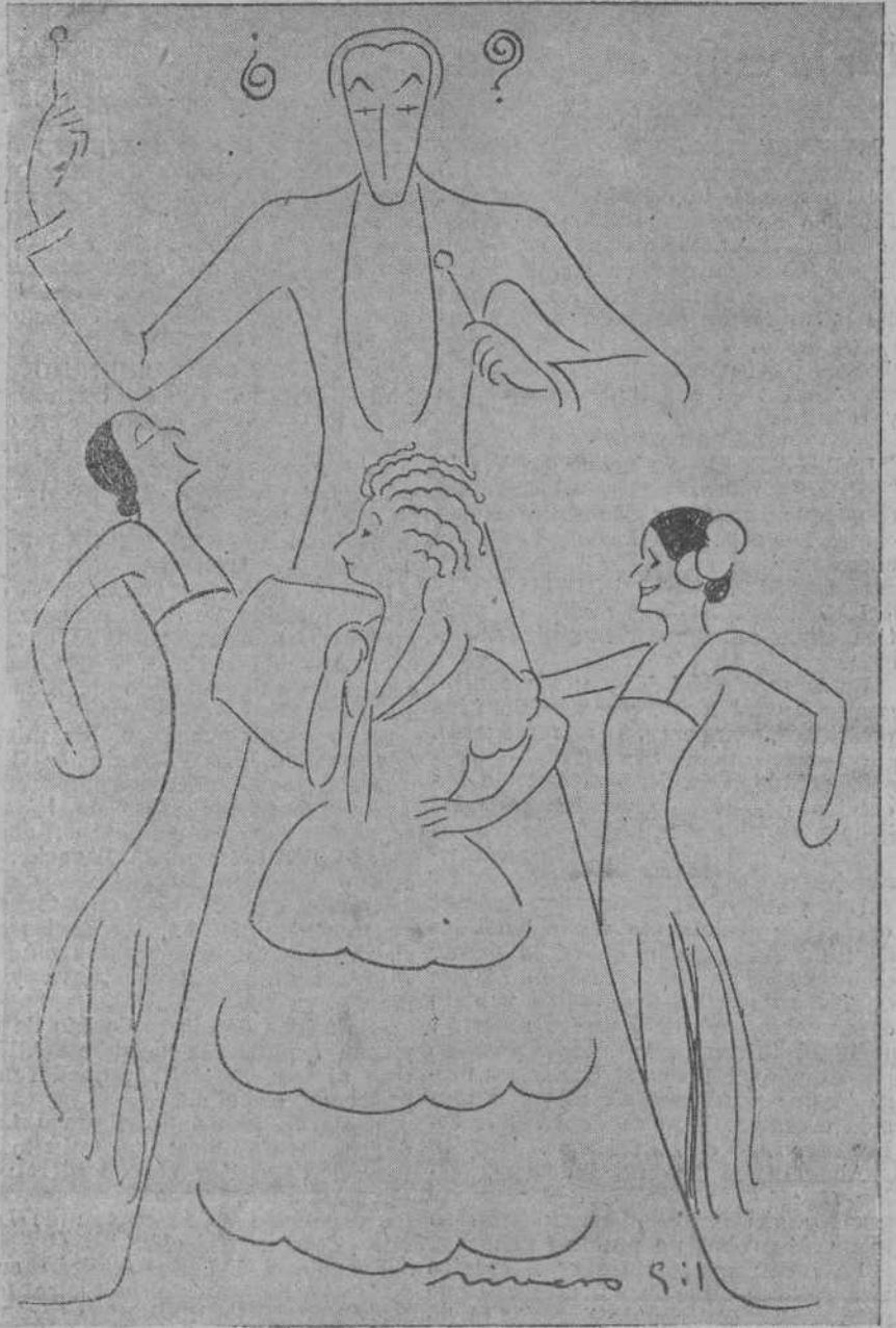
DEL CARTEL DEL TEATRO PEREDA. — Los artistas ¿Moreno?, las hermanas Pipiolas y Dora la Cordobesita, vistos por Rivero Gil.

Y todos de acuerdo, se levantó la sesión.