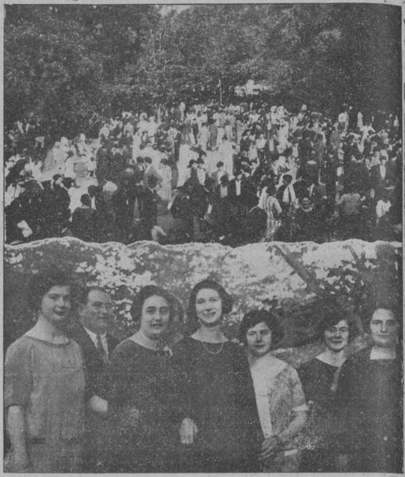
EN GAMA.—UN ASPECTO DEL FIERAL DURANTE LA GRAN ROMERIA CELEBRADA RECIENTEMENTE.—UN GRUPO DE JOVENES EN LA ROMERIA