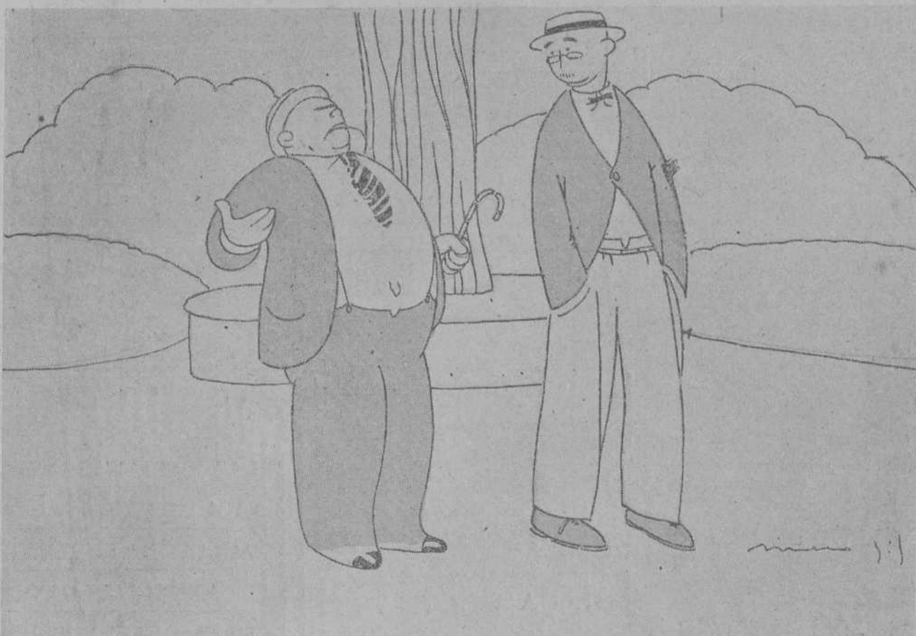
—MIRA, FELPUDEZ, YA ME TIENES CARGADO CON TANTA EXPLICACION DE LO QUE HARAS Y LO QUE DEJARAS DE HACER PARA REALIZAR EL CONCIERTO ECONOMICO. ¿TU QUE PITO TOCAS EN ESE CONCIERTO?