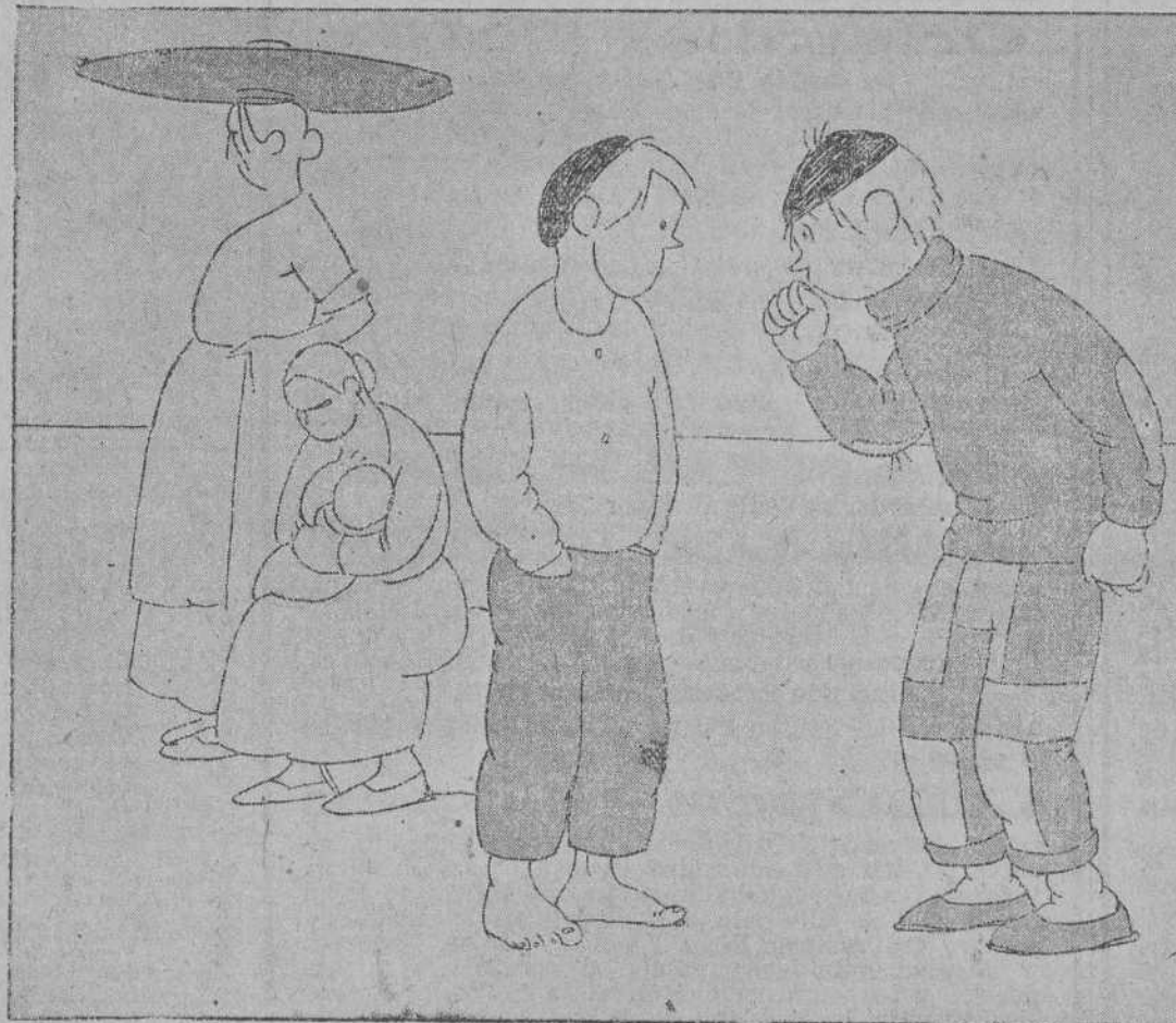
—¡MUCHACHO! ¡SE PESCAN BO CARTES HASTA EN BAHIA! —¿Y QUE? TAMBIEN SE PESCA N MERLUZAS EN TIERRA