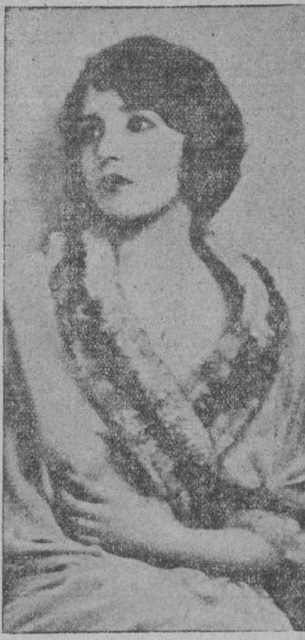
La atrayente Bebé Daniels, posando para «Paramount» en una de sus últimas interpretaciones.

No hay un país en el mundo que tan urgentemente precise dar un mentís rotundo a las vergonzosas mentiras que de nosotros cuentan los indiferentes o los malintencionados. Hay que dar señales creyentes de vida dentro de los demás pueblos. «Cine» es un turismo a la inversa, en que el espectador, sin moverse de su asiento, ve desfilando cuanto de bello e interesante tiene el mundo. Si no nos filamos como los demás por las pantallas extranjeras, es natural que no existamos para los otros países. No hay que olvidar tampoco una curiosa circunstancia: las películas cinematográficas se proyectan forzosamente en la obscuridad, y el hecho de que el espectador no utilice más que el sentido de la vista en este moderno espectáculo da lugar a que aquello que desfila ante sus ojos quede grabado en su memoria con caracteres indelebles. Esto hace que el cinematógrafo sea, pese a quien pese, la más eficaz escuela de costumbres.