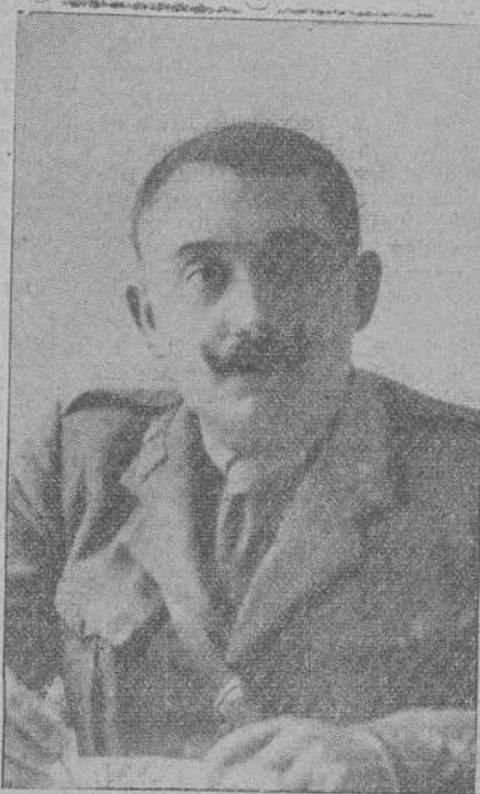
EL ILUSTRE GENERAL DON ALBERTO CASTRO GIRONA