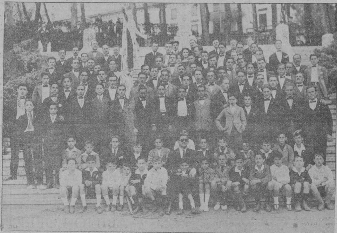
EL NOTABLE ORFEON «ASTILLERO-GUARNIZO» QUE EL DOMINGO DIO UN CONCIERTO EN EL SANATORIO DE PEDROSA.