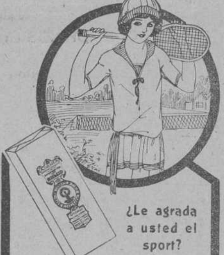
¿Le agrada a usted el sport?

Es natural que le seduzca, porque el deporte fomenta la salud. Pero si el cansancio y el mareo atajan los impulsos de la afición, es evidente que la debilidad se adueña de su cuerpo y hay que combatirla con un tónico. El vigor y la nutrición de la sangre se obtiene tomando diariamente tres cucharadas del JARABE restaurador