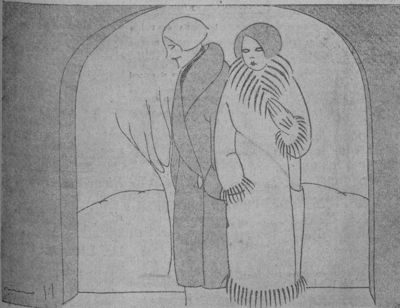
¡CUALQUIERA SE DISFRAZA SIN CARETA! PARA ESO HACE FALTA CAROTA.