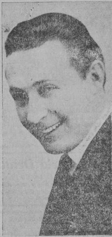
MONTE BLUE, ACTOR CINEMATOGRAFICO DE RELEVANTE PERSONALIDAD ARTISTICA. CREADOR DE UNA NUEVA ORIENTACION EN CINEDRAMA

UNOS ESTUDIANTES DEL CINE.—Con el mayor de los encantos fallaré en el asunto. Aunque como entre