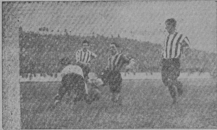
EL FÚTBOL EN BILBAO.—Athletic-Sestao.—Una oportuna salida del portero de Traipig.