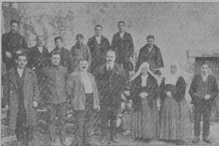
REINOSA.—El dueño del Bar Montañés, de cuyo rasgo caritativo nos ocupamos en esta plana, rodeado de las hermanas del Asilo y de varios amigos.

Esta noche llegarán, precedentes de Santander, 106 mozos de la actual concentración, que permanecerán aquí para salir mañana, a las seis de la