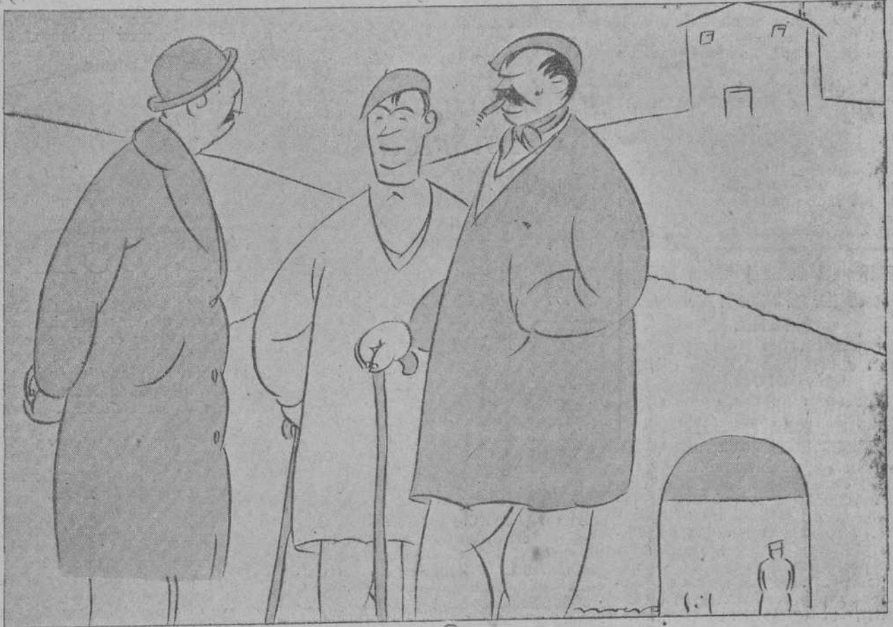
—Y, por fin, ¿quién ha ganado la huelga? —Ha quedado en «tablas»...