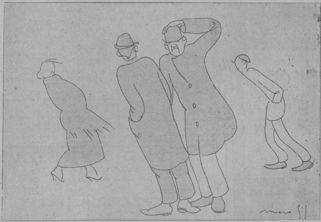
—¡Caramba, Felpúdez! —Usted se ha equivocado, señor... Yo no soy Felpúdez. —Pues, hombre, créame: se da usted un aire...

provincia cia ción a la de Ruana intervenc Seguridad. notable Vega Lame de propo en su car atir las de de cargo; la al cauce de l'intenso principio al ilustre que el en ado por el y felicita ina y Alva USA CELE no mes s de chusa odevilla, B Inigo, Mar por tentat poteses aj r don Victo ores don Ra e García C spertado m e ya tomad iones. rán declar icos de la róxim as de