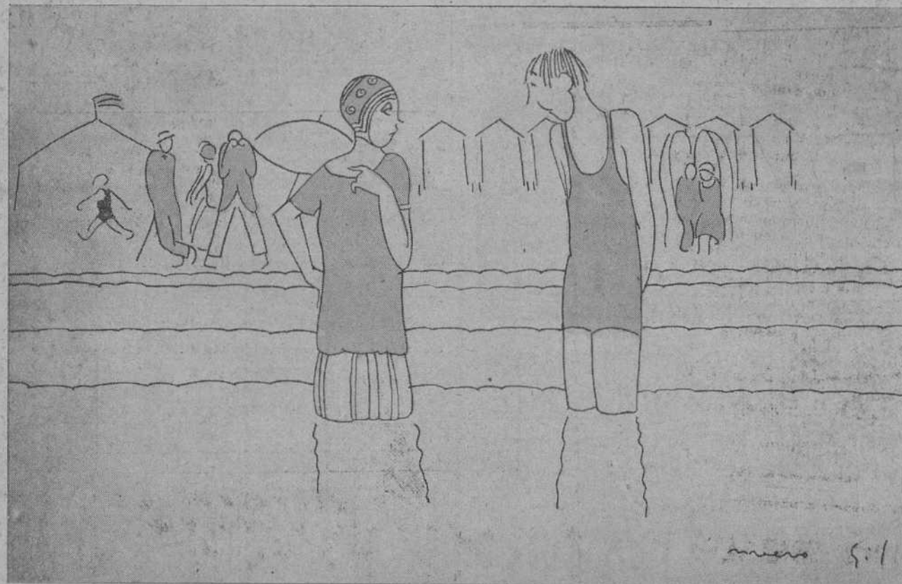
—Chica, no se te ve más que en el agua. —Sí, hijo; es que estoy en plan ostra.