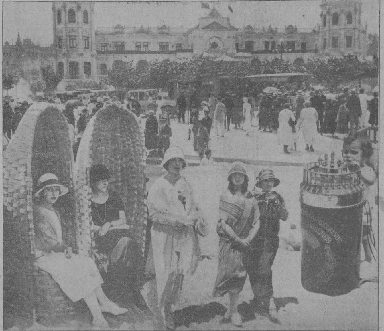
El Sardinero es en estos días el punto de reunión de nuestras bellas y elegantes mujeres y de los encantadores pequeñuelos, que pasan sus mejores horas jugando en la playa.

La reunión bimensual Ayer tuvo lugar en el despacho ofi-