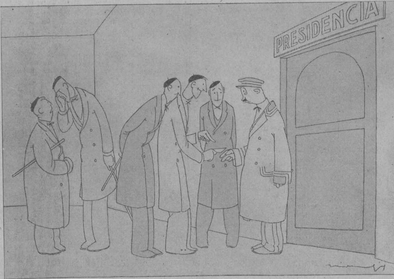
—Dígale usted al señor que venimos a presentarle la cuenta de los festejos.

ucía. ma- pude... riposeaban mación es ecio mu- o conside- is deberes icia se en- penetrante, en obtener lios conse- eros don- del suce- ra de la finas; char- n una pa- el mundo, as que po- ción sensa- LLANOS ril, imira y is mo- itectó- Bellas Ar- dor civil la fecha han ritos arqui- tónicas cas- o dibujos a esa pro- en Santill- Castillo, en Hornos de Buelna; la Villanueva, en Ramales, detallada- mencionada a aplicación las disposi- la ley de onservación tónico-artis- tulo de 1911 zo de 1912, y antigüe- 1924. Visita: en su des- visitas de duardo Don- mbres, don ndez e in- erto. de multas. de Abastos jentes mul- Argeo Hie- de la Nía, obediendo y creando cimiento de Martín Bil- Barguera, avin Cobá, patatas al le de Veg plido lo or- de exis- ite. culos.—Las facienda y eral gover- a Junta de r la tarde le, don Ni- de las Co- teléfonos y mento. con la pri- ta gestio- es, relacio- ción de la circulación no es car- cobran ha- Pero, si no las ha le invita a y quedará