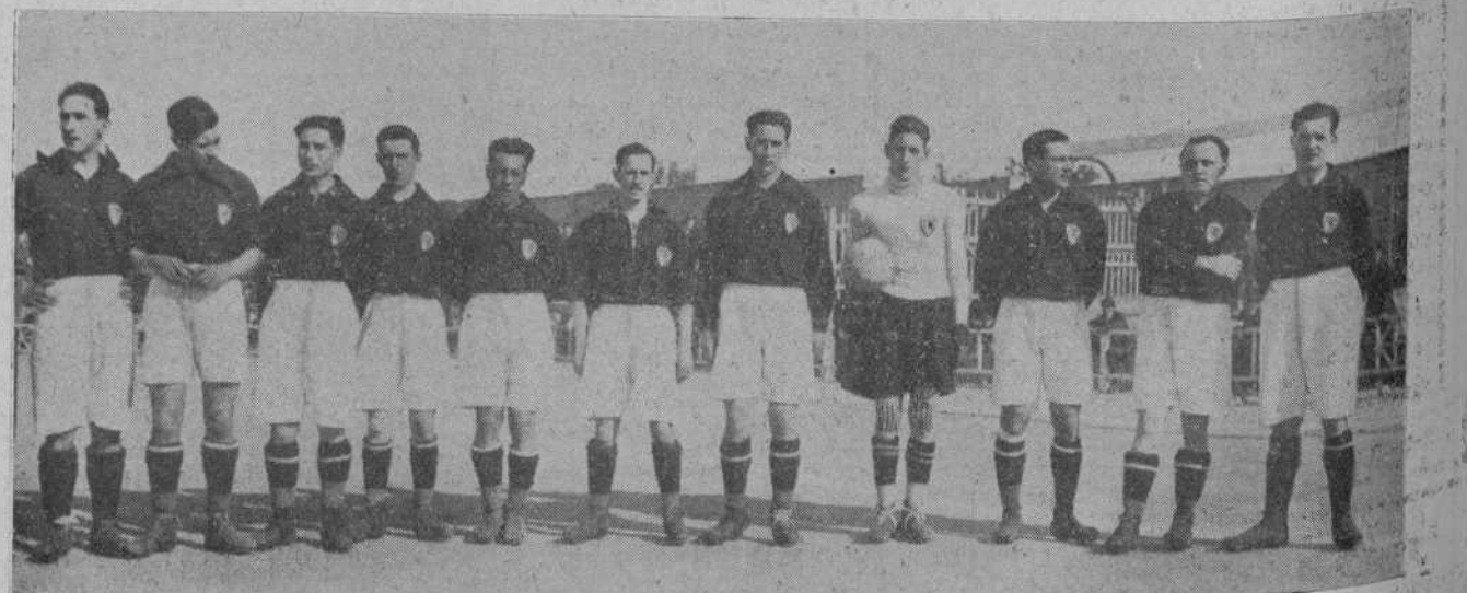
EL EQUIPO REPRESENTATIVO DE CANTABRIA, QUE PERDIO EL DOMINGO POR DOS A CERO, LUCHANDO CON EL DE ARAGON.

Nuestros lectores harían una obra de caridad acudiendo en socorro de este infeliz y de su familia, que no pueden trabajar y que no tienen que llevarse a la boca.