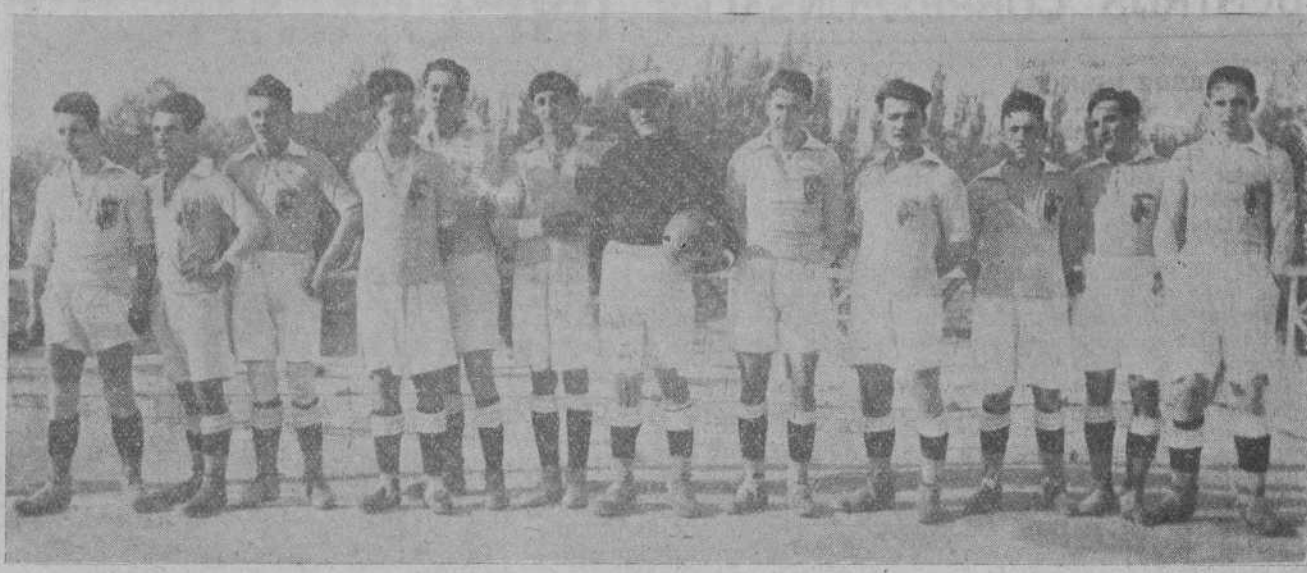
EL EQUIPO DE ARAGON, QUE HA VENCIDO A LA SELECCION DE CANTABRIA.

Los fiscales de la Audiencia y del Supremo que han de formar parte del Tribunal encargado de juzgar a los asesinos del expreso, estuvieron esta noche en la Dirección de Seguridad,