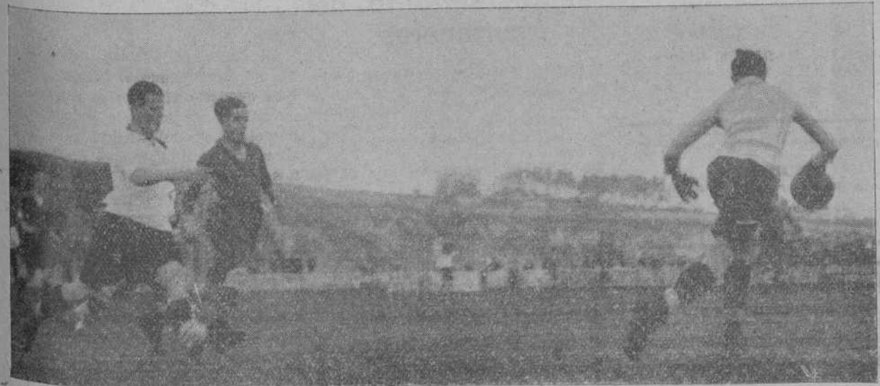
ECLIPSE-TARRASA.—Un momento del partido.

El resultado de este "match", que fué interesante en extremo, fué favorable al infantil de Barreda, como no podía menos de ser, dada la diferencia en su favor de práctica, pues que han jugado ya varios encuentros, además de su mayor peso y altura.