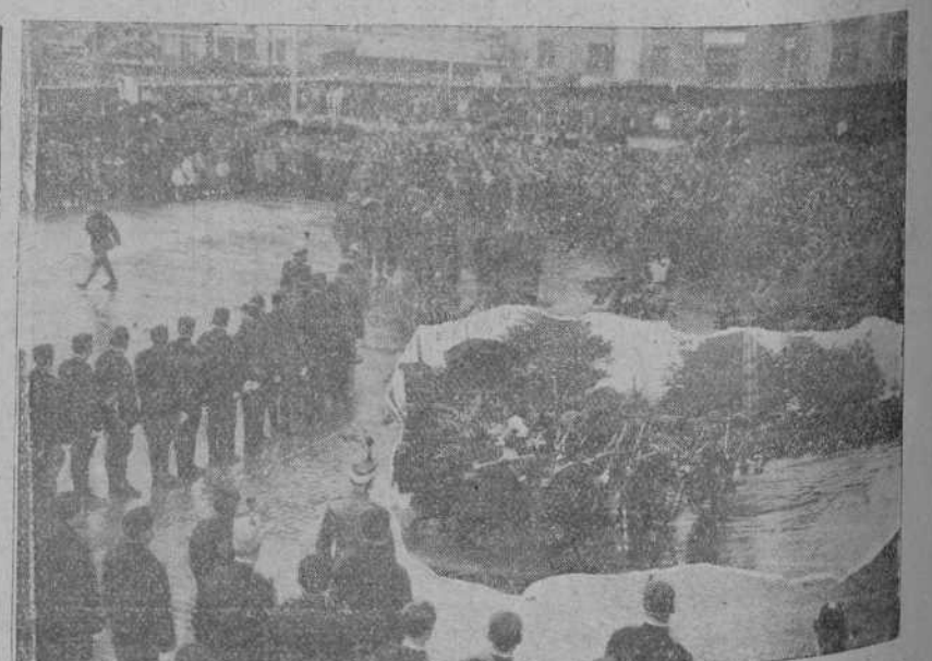
Aspecto que ofrecía la Avenida de Alfonso XIII, durante la jura de la bandera.—Un detalle de la misa: al alzar.

SANTA En MADRID publica es siguientes Real or disponencia de ma diencia pl Promov. or de sei Prisiones te, que lo de Pampl Nombra clase a d ante de con destip disponi ts de los departam una relus que los le tancia a reman a el pirrafc la ley pi com del l Real o gando qi señalado Ayuntamiento el 30 del tin solo inspeccior El tres pachó ho: En su Desphos «El So confratern lebrada i Dice qí garse; pe lis tratar países co Dice qí do un ca do de p: rano de Aboga las medir español; establece; te Espai «El Lil río a la general l gados gu La cal pecialme ondo de tituciona Añade alienta i doméstic cia, pero resanta vuelta a nal. Por ú elemento fia, que cios al a causa Aplaudir jorio, «El l adoptad putar li La ap pone de sea efic. Añade Juzgado trata d lidarida En la ciudad medida «El jue La ut Real de «A pr preside de aque tar la t Pardo mera b trito de conform por la Admimi diente nario, tercero visiona der jud lo quin