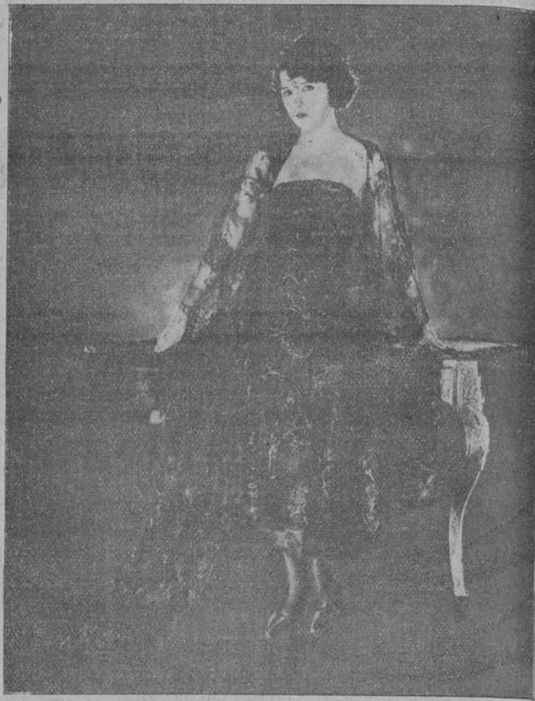
BEBE DANIELS, la bella y sugestiva estrella intérprete de tan diversos personajes, vistiendo una magnífica «toilette».

co programa, en el que sobresalen dos películas; una, de Max Linder, titulada «Siete años de mala suerte», por el interés excepcional que para el público santanderino tiene la reaparición, después de tanto tiempo de ausencia, del inimitable mimo de la pantalla, que con Charlot y sin Charlot, con Harold y sin él, sigue siendo el cómico número uno, y lo otro, por la grandiosidad de la producción. Nos referimos a «Las dos huérfanas», de las hermanas Lillian y Dorothy