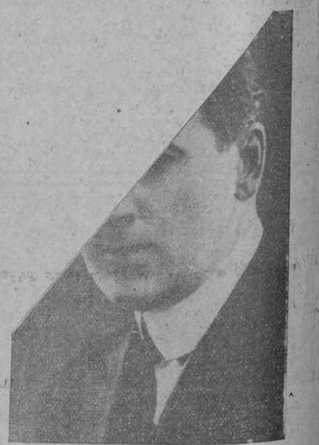
¿Quién es este artista?