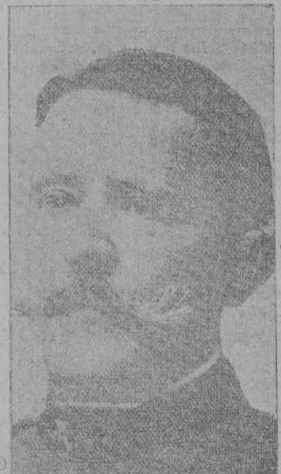
El general Cavalcanti, una de las principales figuras del movimiento militar.