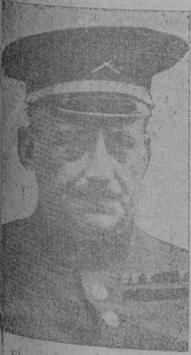
El general Primo de Rivera, encargado por el Rey de formar Gobierno.

El marqués de Alhucemas se dirigió también a Palacio, permaneciendo muy poco tiempo en el regio alcázar.