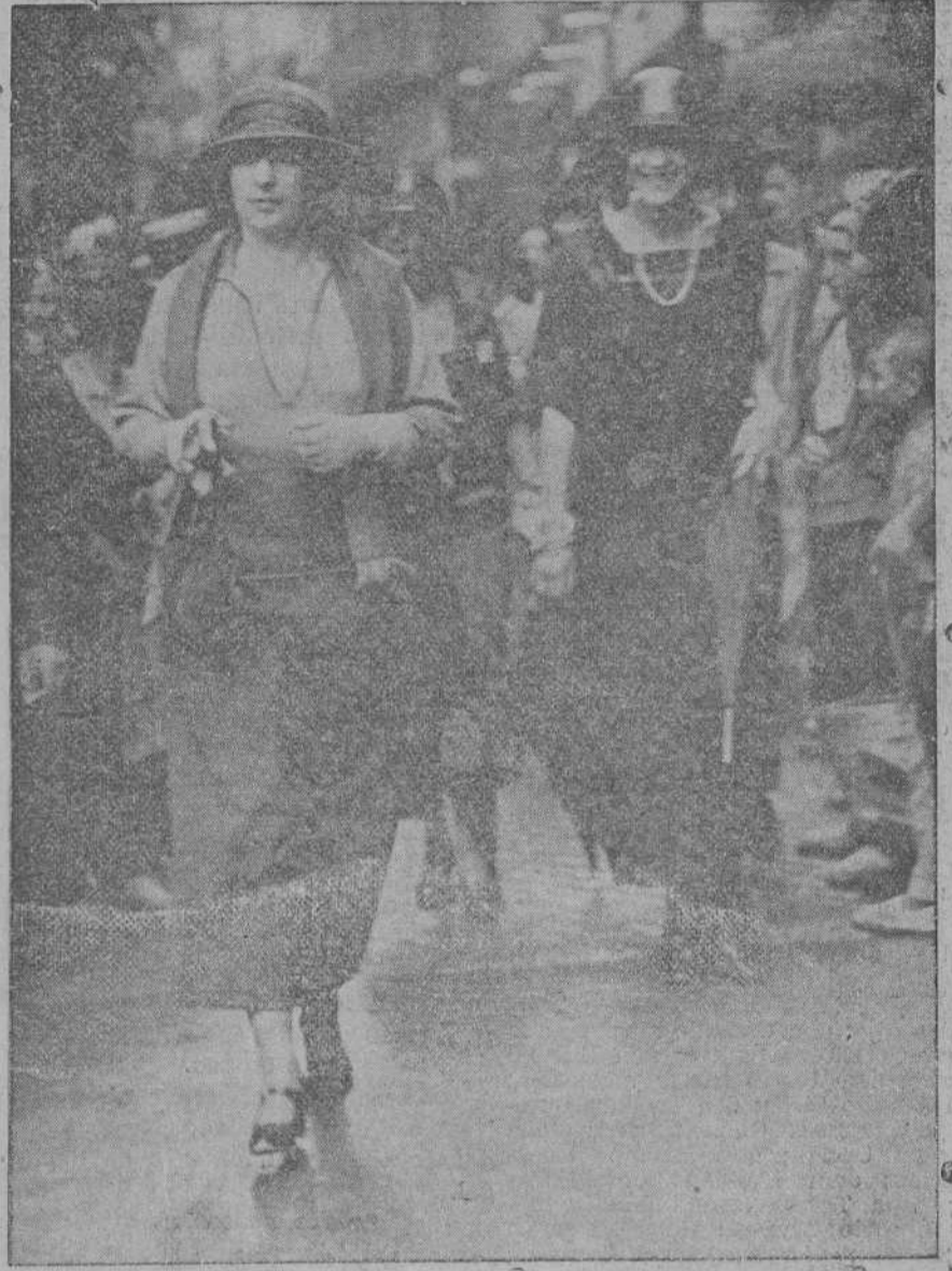
Su Majestad la Reina pasando en la mañana de ayer por la calle de San Francisco.

amplitud y situación, perfectamente definida y accesible, formado por una dársena interior auxiliar, otra dársena para carenas y reparaciones y tres dársenas comerciales.