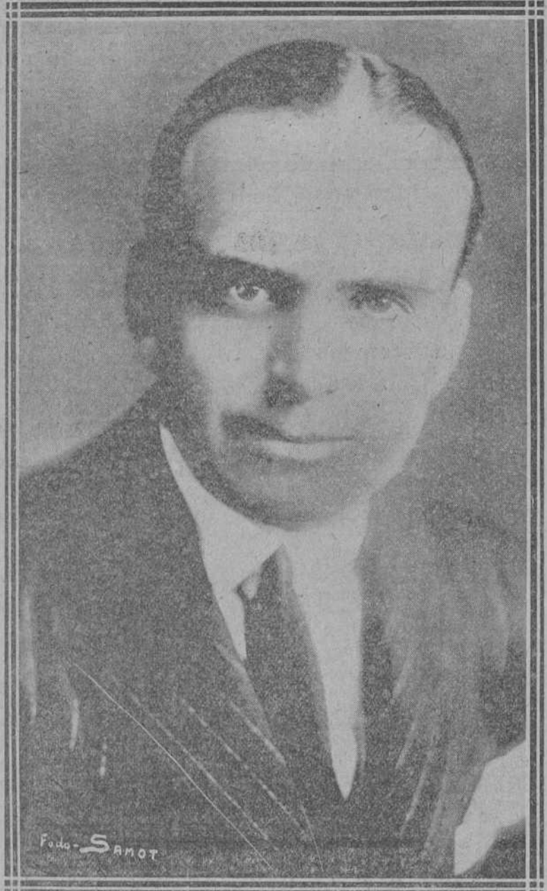
DOUGLAS FAIRBANKS, CÉLEBRE ACTOR CINEMATOGRAFICO, DEL CUAL NOS OCUPAMOS EN ESTA PÁGINA