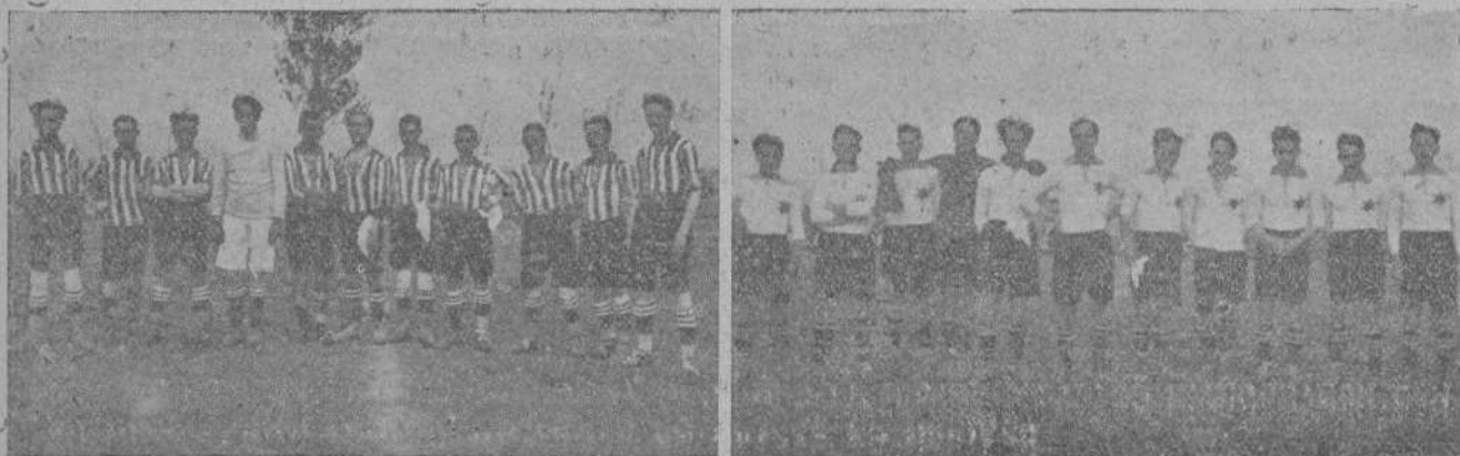
LOS EQUIPOS NEW-RACING Y REINOSA F. C. QUE EL DOMINGO PASADO INAUGURARON CON UN INTERESANTE PARTIDO EL CAMPO DE FUTBOL DE REINOSA

Cántabra de Foot-ball. Principalmente en los pueblos donde radican los equipos de la serie B (Astillero, Guarnizo, Barreda y Muriedas), constituye el comentario obligado de todos los aficionados, y