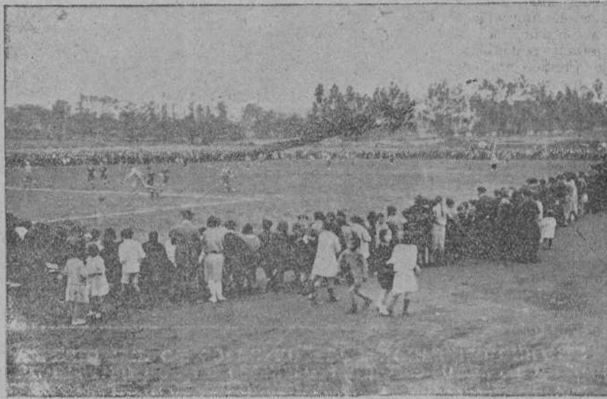
ASPECTO DEL CAMPO DE FUTBOL DE GUARNIZO DURANTE EL PARTIDO QUE SE CELEBRO EL DOMINGO PASADO ENTRE LOS EQUIPOS MURIEDAS F. C. Y CULTURAL DEPORTIVA

Quien viera al Grandjanski en el campo del Sardinero; quien leyera las críticas serenas de los colegas catalanes cuando contra el Barcelona luchó, no puede admitir, sin re-