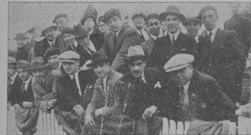
DEL PARTIDO DEL DOMINGO.—Un detalle de la tribuna de socios.

Nuestros futuros rascuistas hicieron una buena demostración de fútbol. No fué tan completa como la verificada contra el infantil del Athletic; pero nos satisfizo.