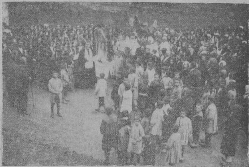
EN ENTRAMBASMETAS.—Las Marías de los Sagrarios en la solemne procesion celebrada el pasado día 29. Foto Riancho.—Ontaneda.)

Por lo demás, como el acta de tal modo obtenida no puede ser válida, el golpe verdaderamente gracioso se- ría que el pueblo de Mora de Rubie- los se negara a devolver «sus» pesetas, suyas y muy suyas, «ganadas» y esto es lo triste—con la dejación de sus derechos ciudadanos.