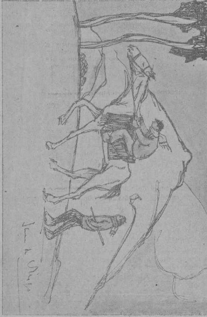
LA ACERBERADA Y FATIGOSA RESPIRACION DE LAS CABALGADURAS...

En un amplio y abrigado invernadero que se asienta al pie del fragoso «Canchal» entre cuñas enormes peñas desprendidas de la alta cumbre crece enmarañada y bravía una apretada mancha de abedules, brezos y espinos, se dejaron los caballos al pesebre con abundante y oloroso heno y se continuó a pie, a monte traviesa, hasta los puestos por una inclinadísima ladera, tan tiesa y dificultosa que fué necesario prestar ayuda a algunos débiles de piernas y más hechos a pisar mullidas alfombras y aceras asfaltadas, que el duro y áspero terreno de la sierra.