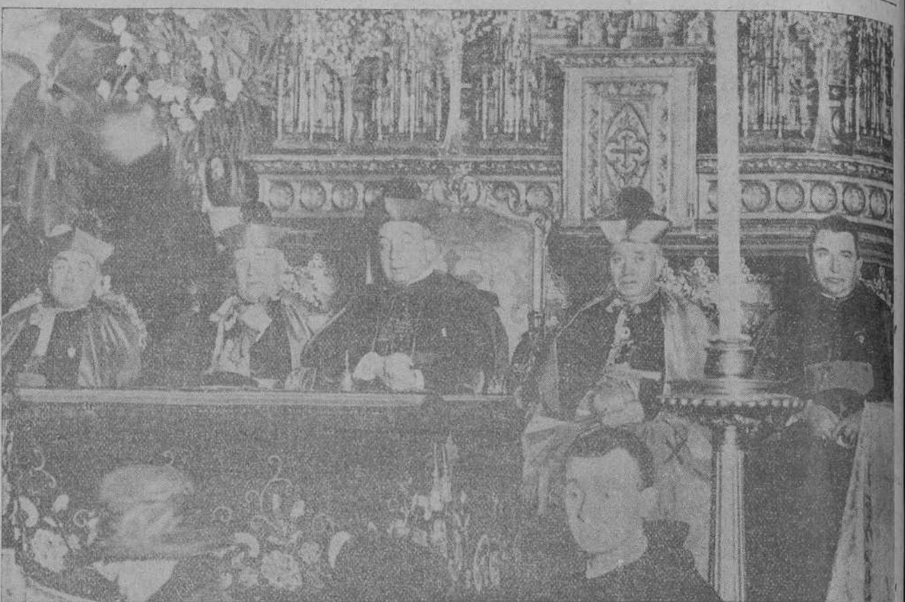
PRESIDENCIA DE LA SESION INAUGURAL DEL CONGRESO TERESIANO NACIONAL CUYO PRESIDENTE ES EL CARDENAL BENLLOCH

Las que no sean recogidas en el día indicado serán puestas a la venta en el dicho establecimiento desde el martes próximo.