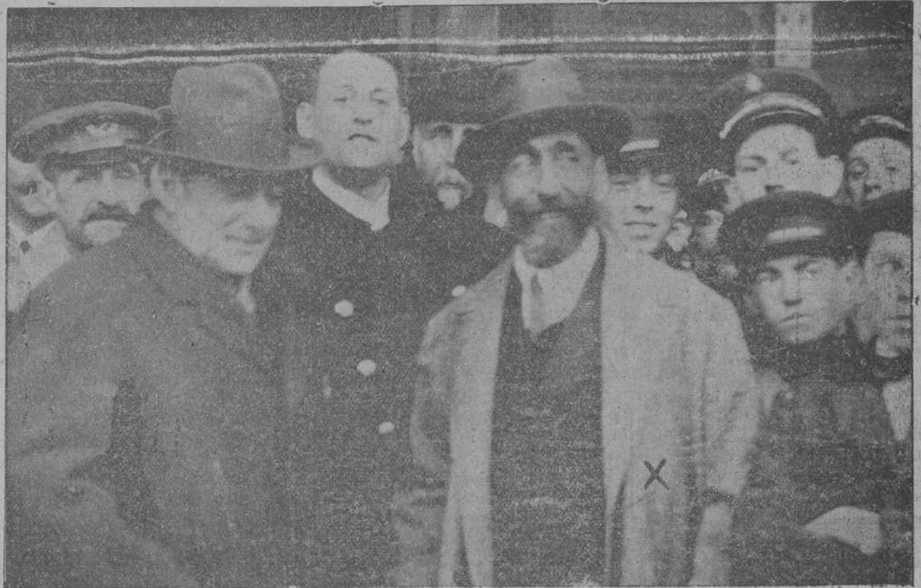
EL GENERAL NAVARRO EN LA ESTACION, A SU LLEGADA A MADRID.

Para ello basta con que el pueblo quiera.