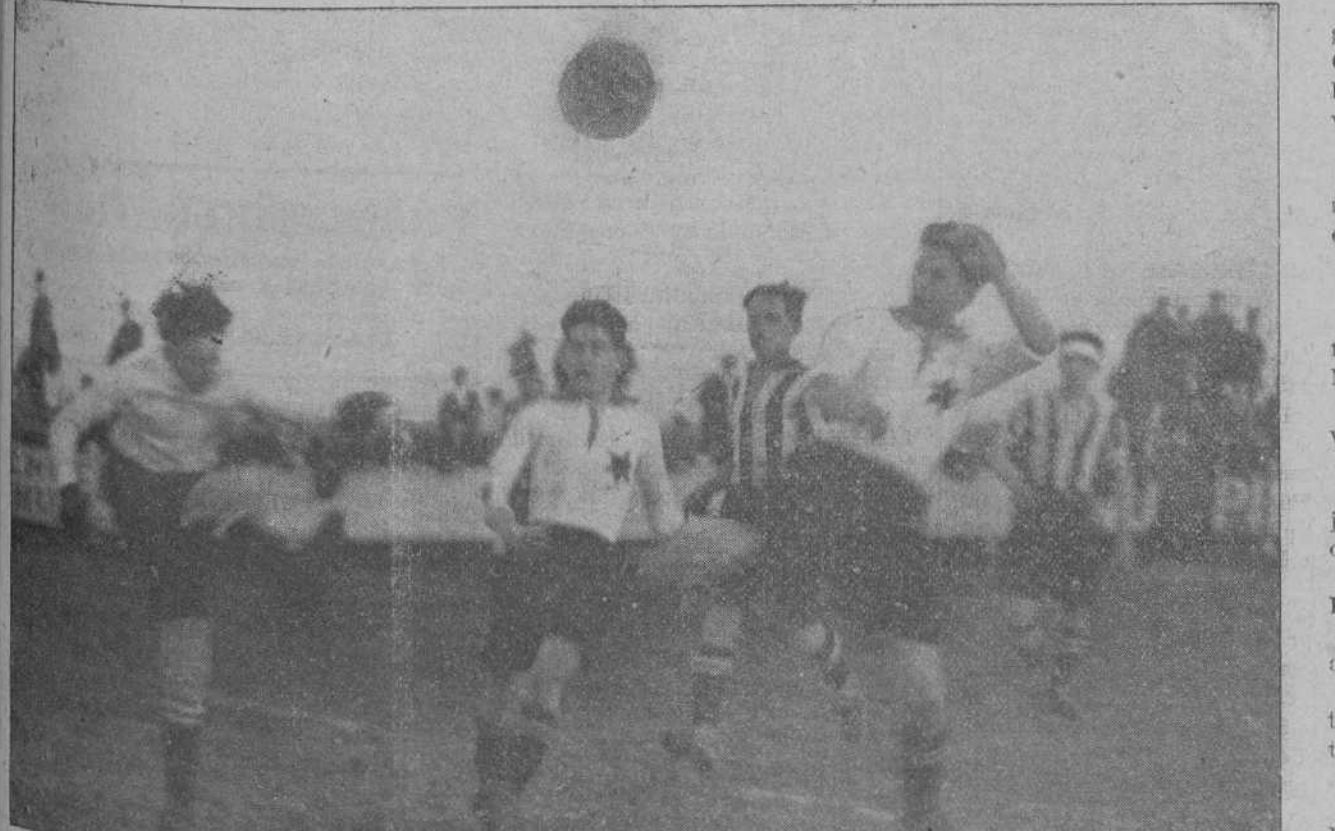
DEL PARTIDO NEW RACING CLUB—ALBERICIA SPORT.—El portero del Albericia salva un momento difícil para su meta en un ataque de Bueno y Gacitaga.

LA LINEA, 15.—Jugaron un partido de foot-ball los equipos San Fran-