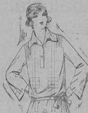
Blusas de crepón de seda, en negro, azul y color, adornos calados. De ptas. 30 a 65.