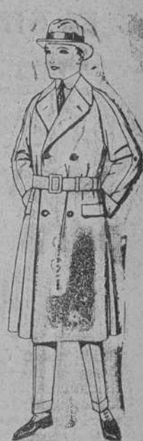
Gobanes cruzados de cheviot, cower o pluma. De ptas. 125 a 160.