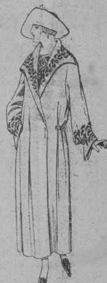
Abrigos de terciopelo de lana, gamuza, pañete, etc. en negro, azul y color, adornos bordados. De ptas. 80 a 95.

Calzados a precios de fábrica. Borceguines caballero desde 16,50 ptas. Zapatos para señora desde 14 ptas.