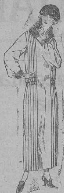
Vestidos de sarga inglesa, crepé, etc., en negro, azul y color, adornos piel. De ptas. 125 a 160.