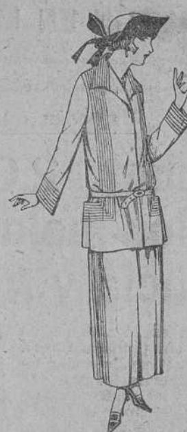
Trajes sastre, de popeline, estambre, etc., adornos respuntes seda, chaqueta forrada de seda, en marino, negro y colores moda. De ptas. 125 a 160.