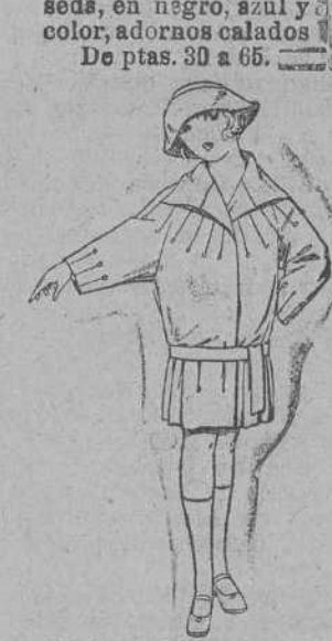
Abrigos de terciopelo de lana, en azul y color, adorno respunte seda, para niños de 4 a 9 años. De ptas. 25 a 47.