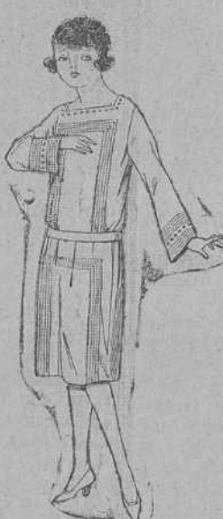
Vestidos de sarga inglesa, gabardinas, etc., en azul y color, para jovencitas de 12 a 15 años. De ptas. 63 a 80.