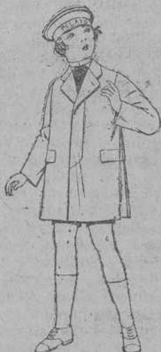
Gabanes de patón, gamuza, etc., para niños de 4 a 9 años. De ptas. 25 a 50.

Ropas confeccionadas para Caballero, Señora, Niño y Niña.