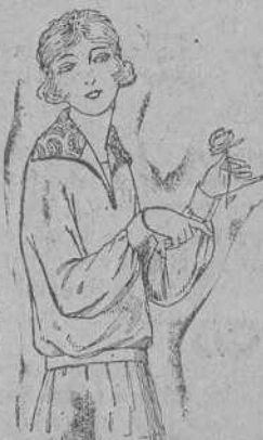
Blusas de punto de seda, diferentes colores, adornos bordados. De ptas. 55 a 75.