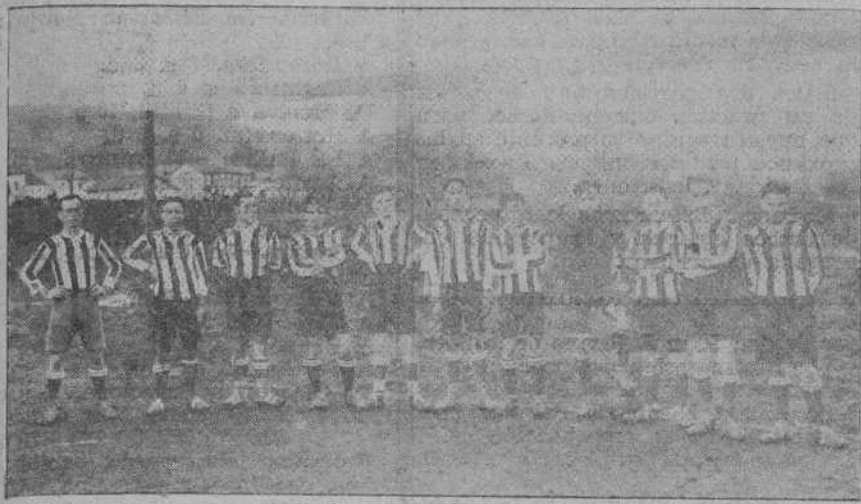
EQUIPO «DEPORTIVO CUDEYO».