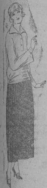
Faldas de popeline, estambre, etc., en negro, azul y color. De ptas. 38 a 50.