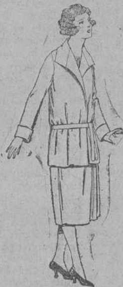
Trajes de estambre, lanilla, etc., en azul y color, para jovencitas de 12 a 15 años. De ptas. 26 a 50.