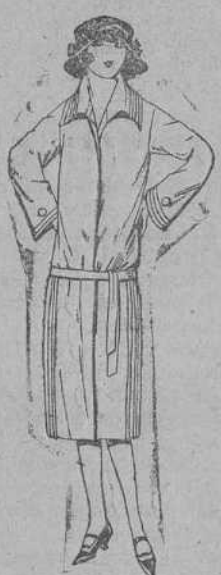
Abrigos de terciopelo de lana, gamuza, etc., en negro, azul y color para jovencitas de 12 a 15 años. De ptas. 50 a 70.