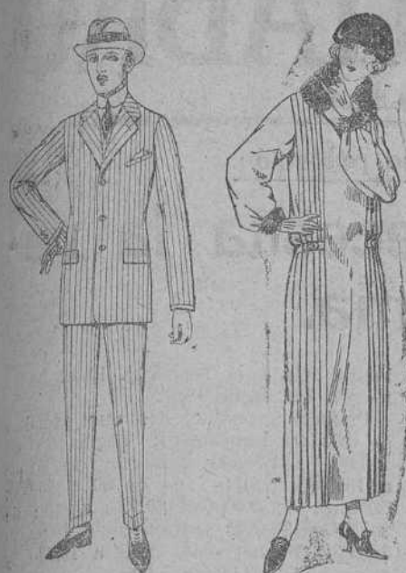
Trajes de cheviot, pa-tón, estambre, etc. De ptas. 38 a 135.

Sucursales: Madrid, Barcelona, Alicante, Almería, Bilbao, Cádiz, Cartagena, Gijón, Granada, Málaga, Palma de Mallorca, Santander, Sevilla, Valencia, Valladolid, Zaragoza.