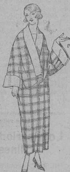
Batas de franela de lana, dibujos novedad, diferentes colores y dibujos. De ptas. 27 a 38.