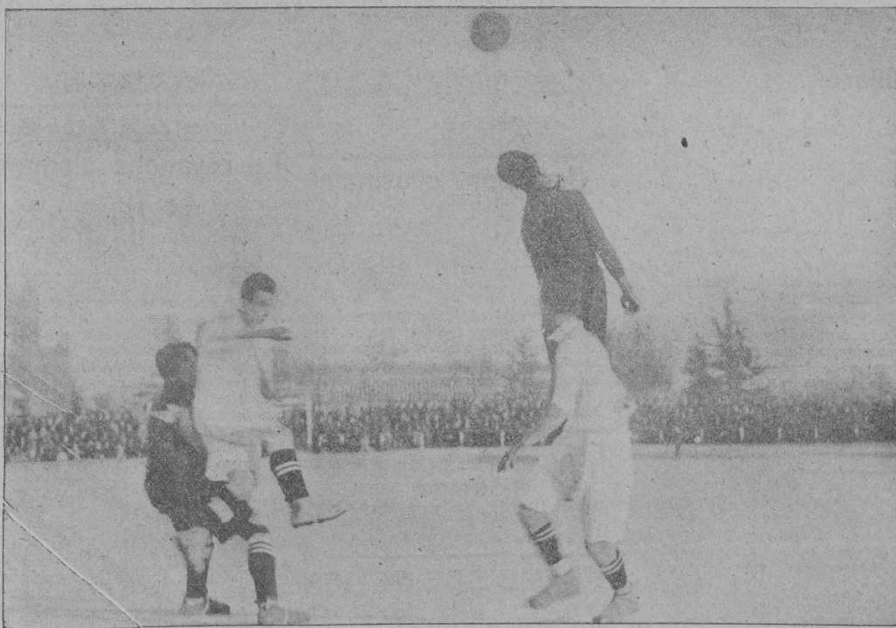
UNA JUGADA INTERESANTE DEL PARTIDO CELEBRADO EN MADRID ENTRE EL REAL MADRID Y EL SEVILLA

RACING-CLUB. Ruiz, Salas, Escalada, Arenal, Chacón, Gutiérrez,