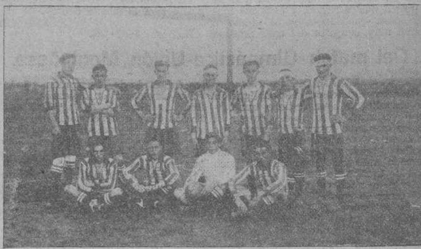
EQUIPO «LAS PRESAS SPORT».