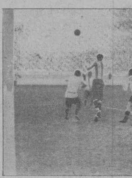
DEL PARTIDO RACING-STADIUM M.— EN UN CORNER, TIRADO POR PAGAZA, SALVA LA SITUACION EL DEFENSA DERECHO AVILESINO

debe de ser correcto y comentar a su gusto la actuación de los equipiers, pero nunca tomar parte directa en el juego ni asaltar el campo. Dentro de éste hay una autoridad indiscutible, según dice el reglamento de foot-ball, y ésta durante su actuación es la que se debe respetar, pues para contrarrestar sus decisiones tiene éste sus autoridades superiores, a las que puede recurrirse para aclarar dudas; esto es hacer deporte y seguir un camino contrario, conduce a deshacerlo.