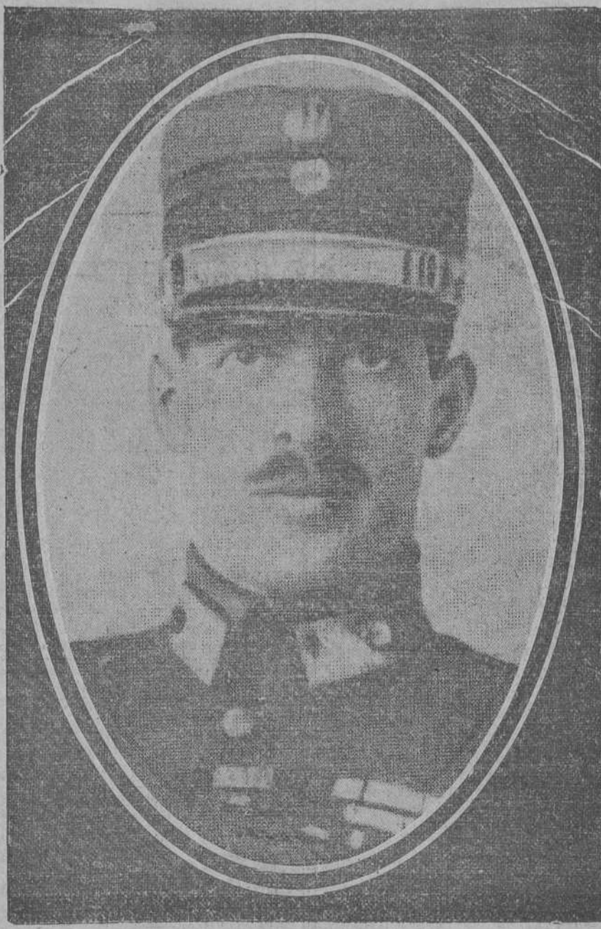
EL REY CONSTANTINO DE GRECIA A QUIEN, DESPUES DE HAGERLE ABDICAR, LE HAN OBLIGADO LOS REVOLUCIONARIOS A ABANDONAR EL TERRITORIO