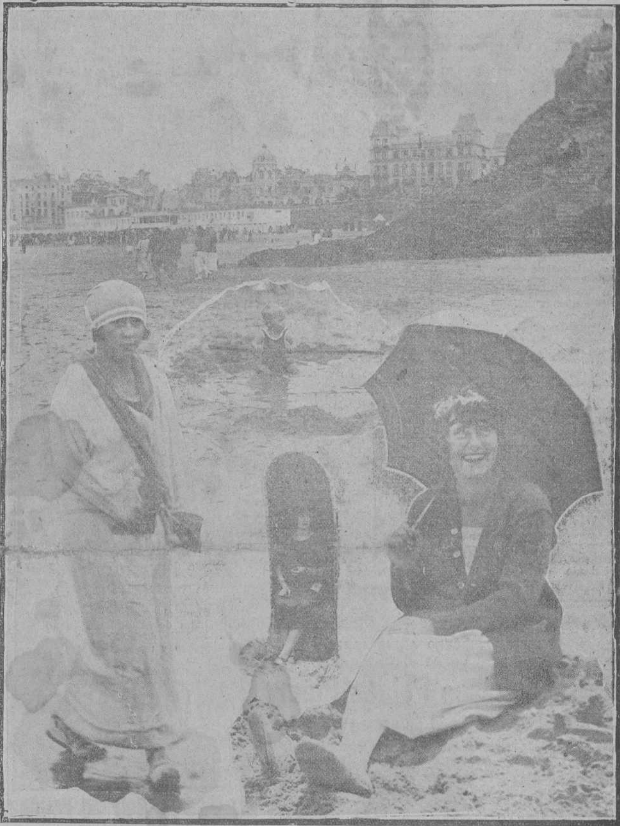
ESCENAS DE LA PLAYA