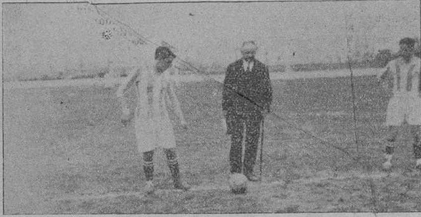
EL ALCALDE DE TORRELAVEGA EN EL MOMENTO DE EMPUJAR CON EL PIE EL BALON EN LA INAUGURACION DEL CAMPO DE DEPORTES DE DICHA CIUDAD

Hermosa tarde londinense. Mujeres de la más rica cepa montañesa. Alegría y gloria para Torrelavega. Unos muchachos nervudos que golpean con saña un esférico, hueco,