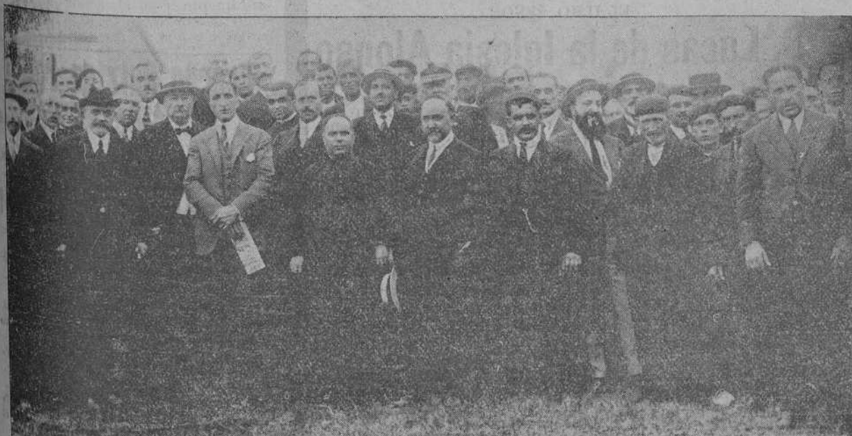
GRUPO DE INVITADOS AL SOLEMNE ACTO DE POLANCO

han de darle aquellos que me han precedido y los que han de sucederme en el uso de la palabra.