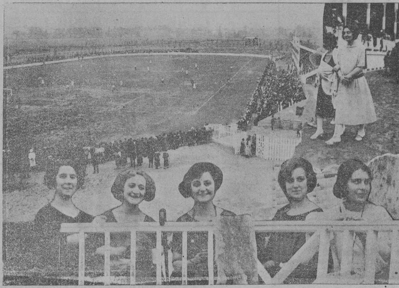
ASPECTO DE LOS CAMPOS DEL MALECON, DE TORRELAVEGA, EL DIA DE SU INAUGURACION. UNA TRIBUNA OCUPADA POR BELIAS SENORITAS TORRELAVEGUENSES