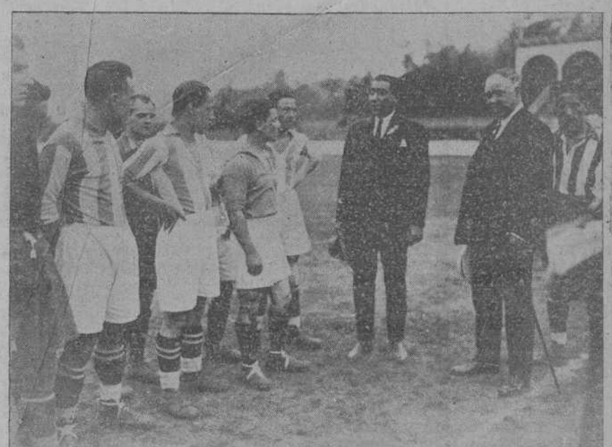
UNA REPRESENTACION DE LA GIMNASTICA SALUDANDO A LOS EQUIPOS DEL ATHLETIC Y LA REAL SOCIEDAD MOMENTOS ANTES DE LA INAUGURACION OFICIAL DEL CAMPO DE TORRELAVEGA

Así y todo, sus atques fueron cortinos, ejecutando un franco dominio, después que Lakatos, apoggiendo una pelota que había rebotado en el larguero, marcó el tercer goal para el Athletic. Su goal, el del honor, fué debido a un habilidoso remate de Galatas a un balón que procedía del ala izquierda. La habilidad consistió en aprovechar el «muro humano» que existía ante la portera