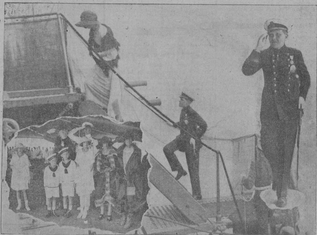
El príncipe de Asturias subiendo por la escala del «España» con el uniforme de guardia marina.—El príncipe a bordo, saludando a los jefes y oficiales.—Sus Altezas Reales los infantes, los duques de Aosta, Santoña y San Carlos, en la cubierta del «España» al llegar el príncipe.

El Rey se expresó así: Señoras y señores: Yo creí que hoy iba a tener únicamente la satisfacción de presidir la asamblea de periodistas españoles. Pero amable y cariñosamente requerido por el señor Blanco, el cual ha dicho de mí