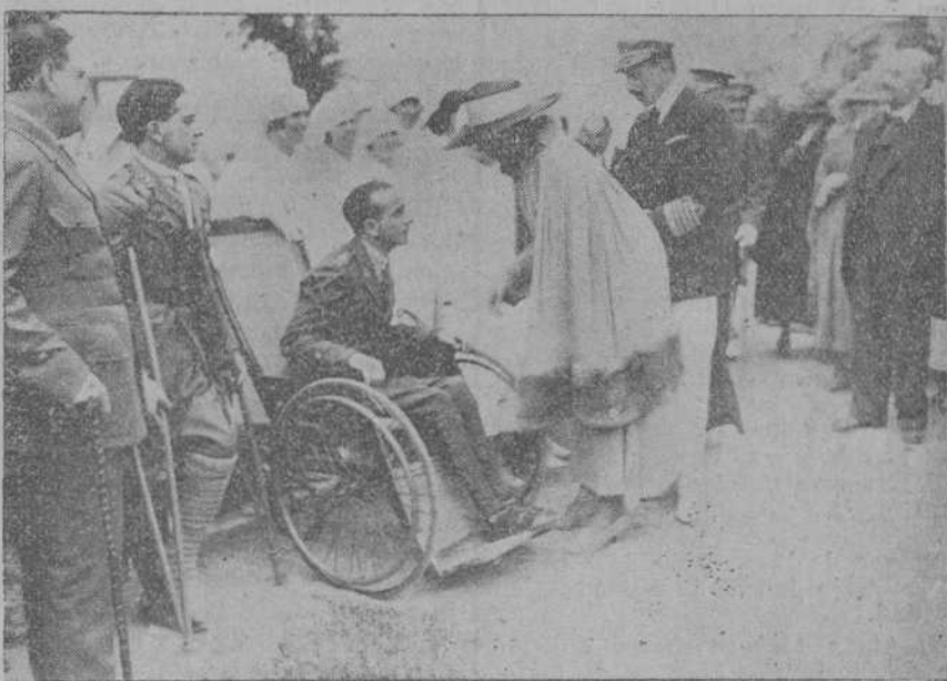
LOS REYES HABLANDO CON UN CAPITAN HERIDO, DURANTE LA VISITA QUE AYER REALIZARON AL HOSPITALILLO DE ADARZO

LOS INFANTITOS Por la mañana bajaron a la plaza, como de costumbre.