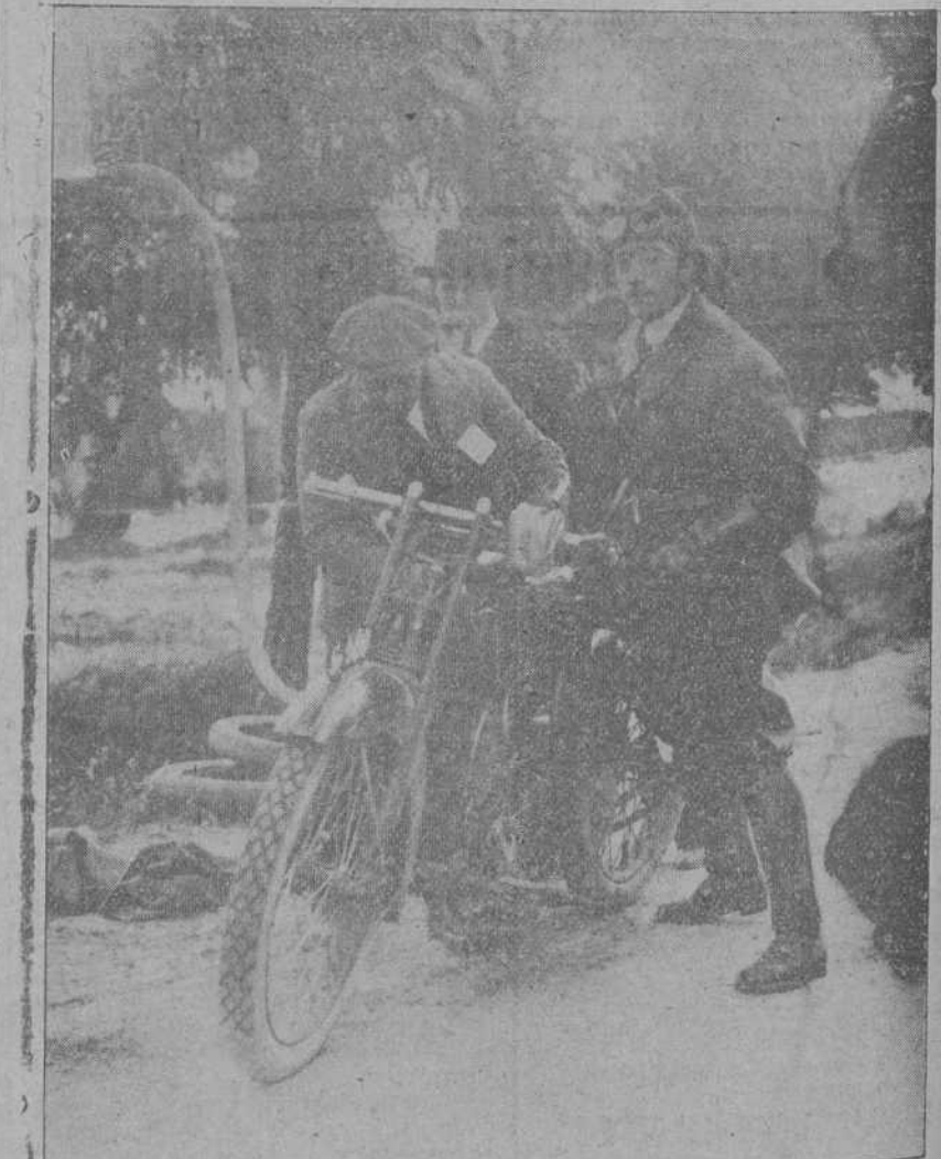
LA CARRERA DE LAS DOCE HORAS.—Subyación Torcida, de Santander, que hizo un bonito recorrido, llegando en quinto lugar.

Y que se está haciendo una labor un descargada y perjudicial para el sport futbolístico, que se arroja y ape-na el pronosticar su resultado nefasto.